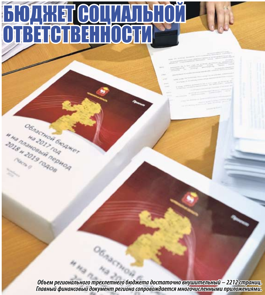
Объем регионального трехлетнего бюджета достаточно внушительный – 2212 страниц. Главный финансовый документ региона сопровождается многочисленными приложениями.