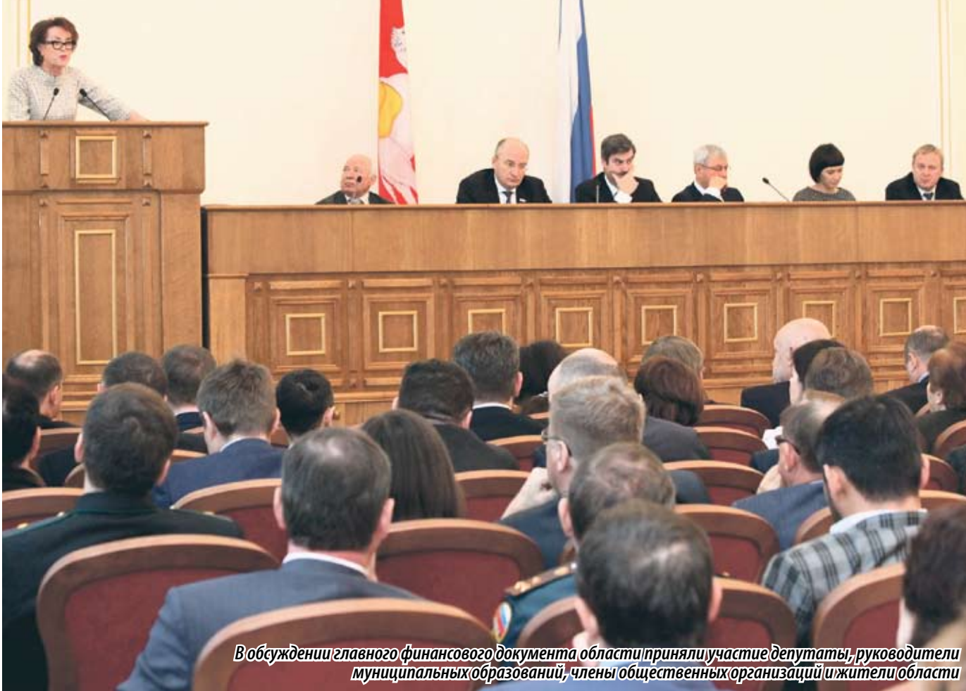
В обсуждении главного финансового документа области приняли участие депутаты, руководители муниципальных образований, члены общественных организаций и жители области

С 30 НОЯБРЯ, С МОМЕНТА ВНЕСЕНИЯ ПРОЕКТА РЕГИОНАЛЬНОГО БЮДЖЕТА В ЗАКОНОДАТЕЛЬНОЕ СОБРАНИЕ, И В ТЕЧЕНИЕ ДВУХ НЕДЕЛЬ ДЕПУТАТЫ ОБСУЖДАЛИ ЕГО С КОЛЛЕГАМИ НА ЗАСЕДАНИЯХ ПРОФИЛЬНЫХ КОМИТЕТОВ, С НАСЕЛЕНИЕМ В СВОИХ ИЗБИРАТЕЛЬНЫХ ОКРУГАХ, СОСТАВЛЯЯ РЕКОМЕНДАЦИИ. 15 ДЕКАБРЯ ПРИ УЧАСТИИ ШИРОКОЙ ОБЩЕСТВЕННОСТИ СОСТОЯЛИСЬ ПУБЛИЧНЫЕ СЛУШАНИЯ ПО ПРОЕКТУ ЗАКОНА ЧЕЛЯБИНСКОЙ ОБЛАСТИ «ОБ ОБЛАСТНОМ БЮДЖЕТЕ НА 2017 ГОД И ПЛАНОВЫЙ ПЕРИОД 2018 И 2019 ГОДОВ».