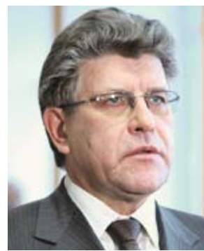
Александр ЖУРАВЛЕВ , председатель комитета Законодательного Собрания по социальной политике:

« На первоначальном этапе формирования бюджета планируемые расходы превысили предельные возможности прогнозируемых доходов на 43,9 миллиарда рублей. В результате детального анализа каждой из заявленных сумм и в ходе работы межведомственной комиссии под руководством губернатора расходы были сокращены почти вдвое. К сожалению, расчетная потребность по отдельным направлениям больше, чем предусмотрено в проекте бюджета. Вместе с тем, правительство региона совместно с депутатским корпусом сможет внести эти расходы дополнительно в ходе исполнения бюджета, если экономическая ситуация будет развиваться по более благоприятному сценарию и в области появятся дополнительные доходы. »