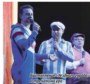
Выступление «Уездного города» встречали на ура