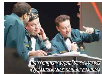
Кавээнщики могут даже в самых серьезных делах найти смешное