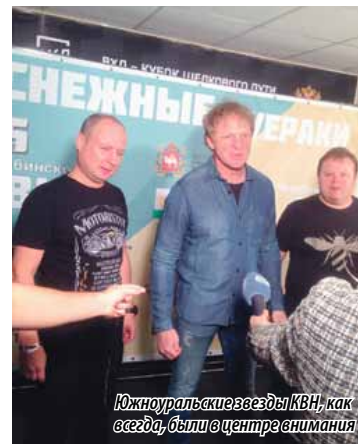
Южноуральские звезды КВН, как всегда, были в центре внимания

ПРЕДСЕДАТЕЛЬ ЗАКОНОДАТЕЛЬНОГО СОБРАНИЯ ЧЕЛЯБИНСКОЙ ОБЛАСТИ ВЛАДИМИР МЯКУШ (ФРАКЦИЯ «ЕДИНАЯ РОССИЯ») ПОЗДРАВИЛ ЧЕЛЯБИНСКИЙ «КЛУБ ВЕСЕЛЫХ И НАХОДЧИВЫХ» С 25-ЛЕТНИМ ЮБИЛЕЕМ. И ДАЖЕ ПОБЫВАЛ В РОЛИ ПРЕДСЕДАТЕЛЯ ЖЮРИ.