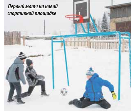
Первый матч на новой спортивной площадке

«Идет промежуточный этап реконструкции школы № 1 в Нязепетровске. К сожалению, аукционные мероприятия были проведены позже, и многие работы по благоустройству, которые выполняются на завершающем этапе, пришлось выполнять с общестроительными работами. На данный момент ремонт в школе еще продолжается. Тем не менее, завершается замена кровли, прокладка потолочного покрытия. В следующем году реконструкция обязательно завершится.»