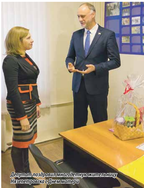
Депутат поздравил многодетную жительницу Нязепетровска с Днем матери

«Избирательный округ «Северный» — непростой округ, удаленность поселков и от областного центра, и от городов районного значения достаточно большая. И, конечно, хочется, как говорят, достучаться до каждого жителя. А у людей абсолютно разные потребности, начиная от материальной помощи до глобальных вопросов, которые можно решить только на уровне региона, губернатора Челябинской области и Законодательного Собрания. Помимо приема граждан и посещения реконструируемой школы сегодня я принял участие в открытии многофункциональной спортивной площадки, построенной по программе «Реальные дела». Это еще раз подтверждает: когда жители обращаются с проблемой, что их детям негде заниматься спортом, губернатор, парламентарии, партия «Единая Россия» включаются в решение проблемы. Партийные проекты также реализуются и в Верхнем Уфалее. Достаточно сказать о проекте «Культура малой родины», в рамках которого отреставрирован местный ДК, сделан красивый фасад, заменены окна и двери. Не говоря уже о ремонте образовательных учреждений, школьных спортивных залов, о поддержке местных театров. Хочу поблагодарить наших жителей за активную гражданскую позицию, могу заверить, что ни одно обращение не будет отложено в стол.»