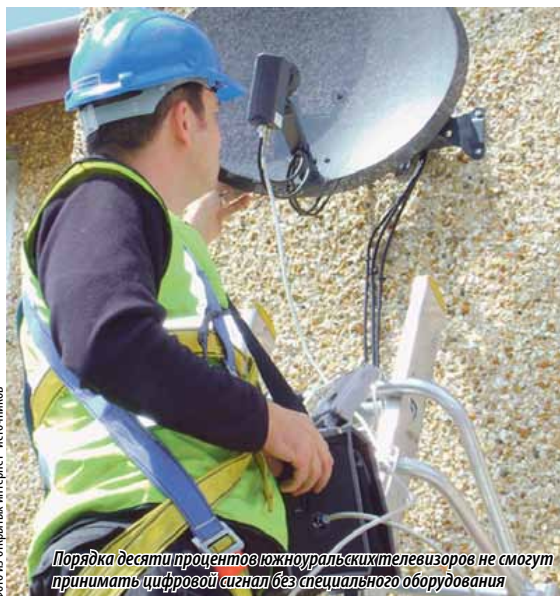
Порядка десяти процентов южноуральских телевизоров не смогут принимать цифровой сигнал без специального оборудования

Как известно, в январе следующего года на Южном Урале прекратится наземное эфирное вещание в аналоговом формате, его заменит цифровое телевидение. Однако в Челябинской области насчитывается 142 населенных пункта, которые на сегодняшний день находятся вне зоны приема эфирного цифрового наземного сигнала. Это значит, что единственным способом передачи телерадиосигнала здесь остается спутник. В этих населенных пунктах проживает четыре с половиной тысячи человек. Кроме того, порядка десяти процентов южноуральских телевизоров не смогут принимать цифровой сигнал без специального оборудования. То есть южноуральцы должны будут приобрести специальные приставки и антенны для того, чтобы иметь возможность смотреть