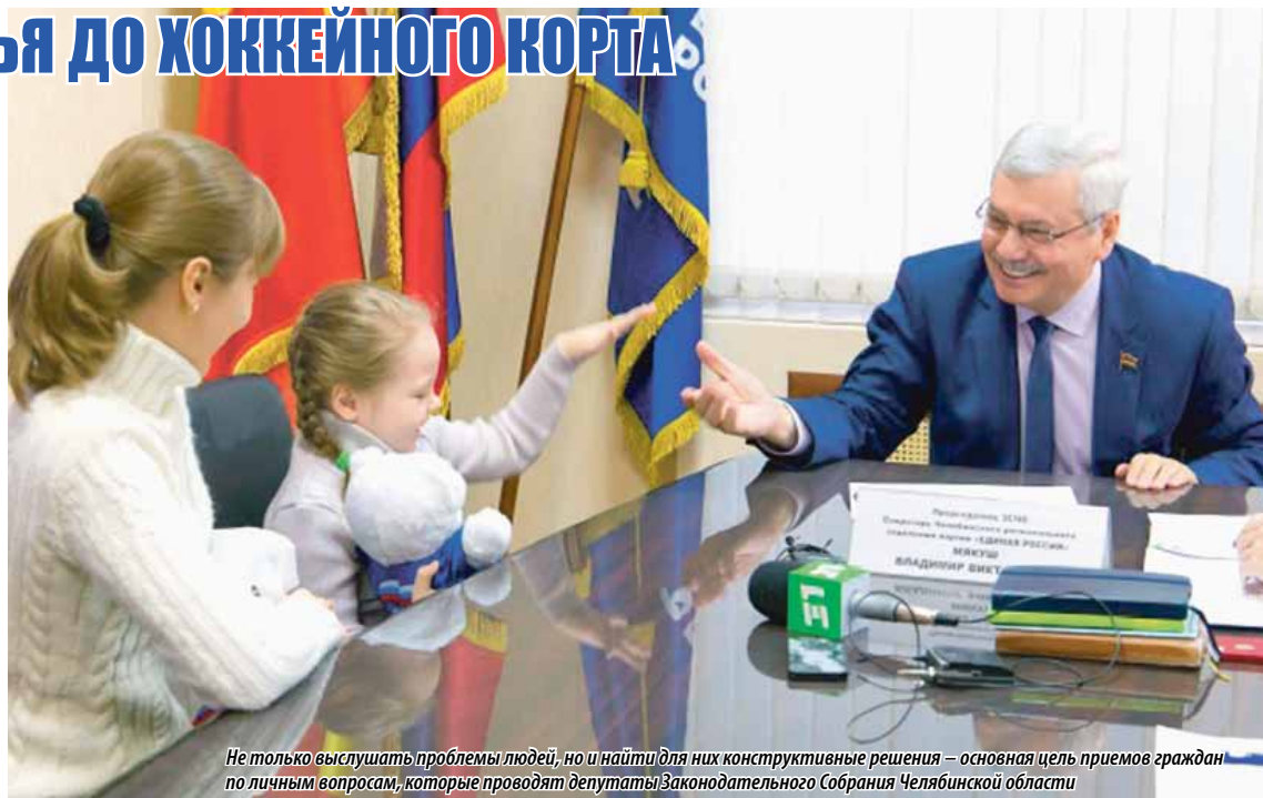
Не только выслушать проблемы людей, но и найти для них конструктивные решения — основная цель приемов граждан по личным вопросам, которые проводят депутаты Законодательного Собрания Челябинской области

— В ближайшее время мы проведем встречу с администрацией медицинского центра, а также с министерством здравоохранения Челябинской области, — прокомментировал руководитель депутатского корпуса Южного Урала. — Уверен, что нам удастся прийти к конструктивному решению. Более того, думаю, стоит проработать систему оказания этой семье помощи в лечении девочки вплоть до ее полнейшего выздоровления.