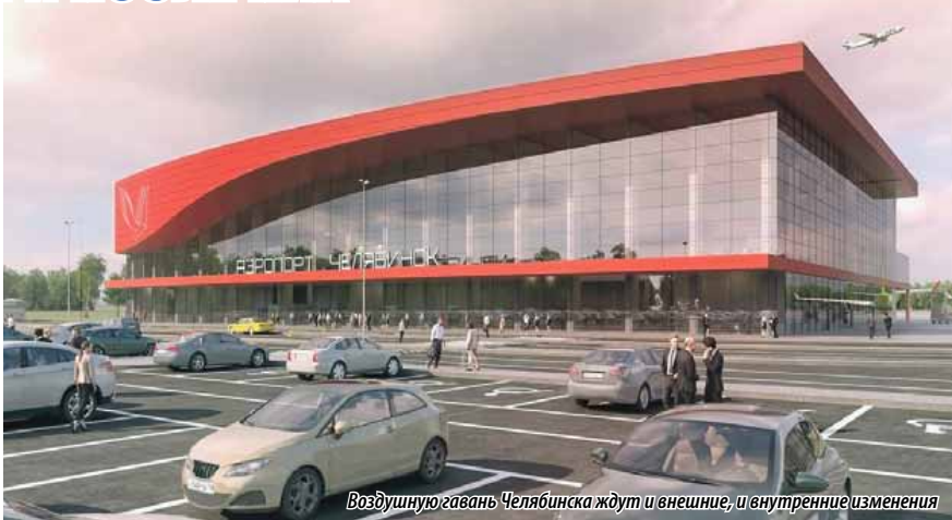
Воздушную гавань Челябинска ждут и внешние, и внутренние изменения

В ходе заседания депутаты также рассмотрели один из приоритетных для комитета вопросов – меры государственной поддержки про-