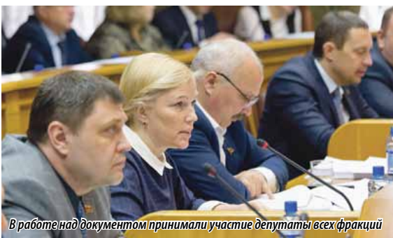
В работе над документом принимали участие депутаты всех фракций

Добавим, что проект закона принят парламентариями в первом и третьем чтениях, минуя второе.