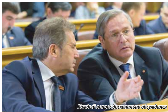
Каждый вопрос досконально обсуждался

Перераспределенные средства региональной казны дополнительно запланированы на увеличение фонда оплаты труда отдельных категорий работников бюджетной сферы, в том числе для финансового обеспечения индикативных показателей по оплате труда в соответствии с майскими указами президента РФ. На эти цели запланировано 519,7 миллиона рублей. 30,11 миллиона рублей предлагается потратить на дополнительное оказание финансовой помощи муниципальным образованиям на решение социально значимых вопросов. Также предусмотрены средства в объеме 20,5 миллиона на финансовое обеспе-