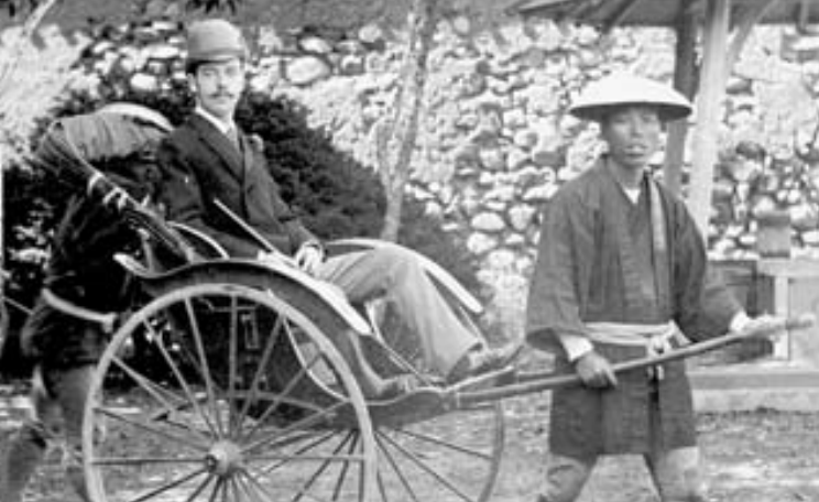
Так выглядел цесаревич Николай Александрович во время своего длительного восточного путешествия. Пребывание в Японии омрачилось террористическим актом против августейшего гостя.