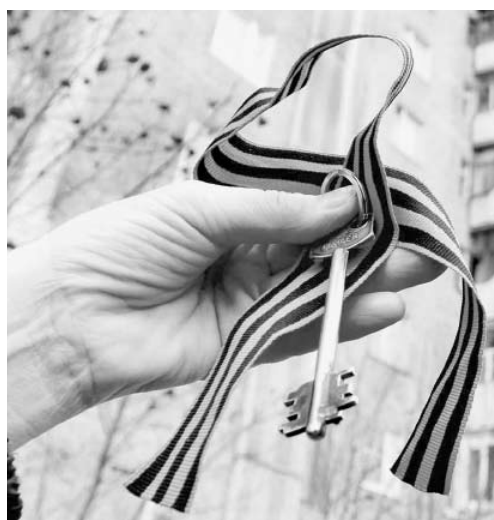
Одна из многих социальных статей – обеспечение жильем ветеранов Великой Отечественной войны

Напомним, в ноябре народные избранники утвердили проект бюджета на предстоящие три года в первом чтении. Как рассказал спикер об-