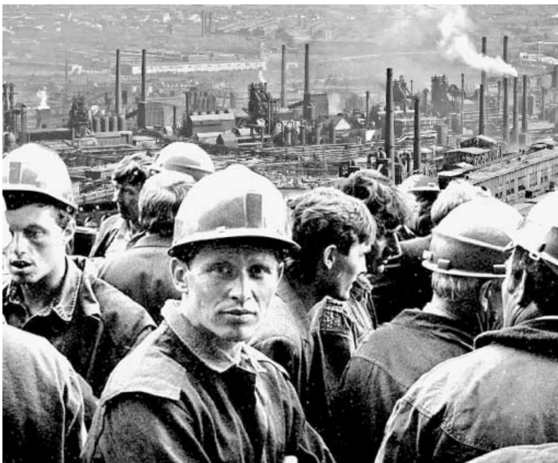
Коллаж Л. Мануриной

на челябинской станции. А народу тьма — пройти невозможно. Директор детдома, срывая голос, кричит: «Пропустите, умрут!» И толпа дала сначала трещину, потом образовался коридор. Пропустили детей. «И дали каждому по тарелке, не супа, — пишет Приставкин, — а жизни. Осознание, что такое люди, пришло здесь же».