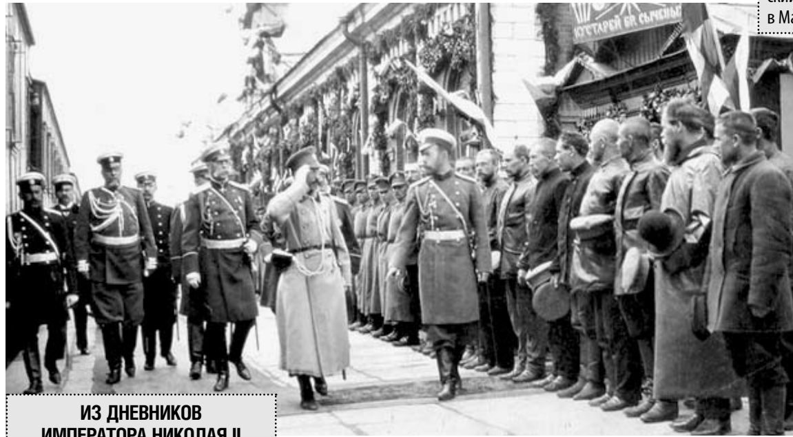
Визит императора в Златоуст, 1904 год. Смотри 214-го Мокшанского и 282-го Черноярского пехотного полков.

тием настолько исключительным, что люди верили: жизнь изменится к лучшему. Да и сам Николай Александрович слышал просьбы народа. Так, в поселке Крутоярском (ныне в Октябрьском районе) казаки рассказали ему о великой беде — пожар уничтожил 150 домов, десятки людей оказались без крова. Погорельцам пожаловали 600 рублей. «Радости казаков не было конца, и со слезами благодарности за великую милость проводжали они далеко за поселок