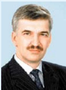
График приема: вторник, 15.00 – 17.00 (Златоуст, ул. Мира, 1, каб. 4, ДК «Победа»)