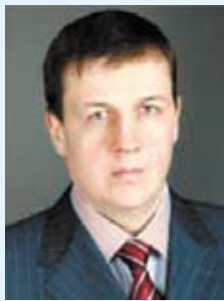
График приема: четверг, 14.00 – 18.00 (Челябинск, ул. Кирова, 114, каб. 10)