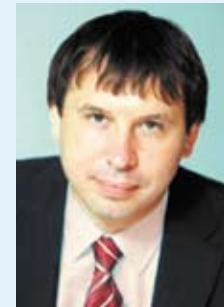
График приема: четвертый вторник месяца, 09.00 – 11.00 (с. Еткуль, ул. Ленина, 34), четвертый вторник месяца, 12.00 – 14.00 (с. Октябрьское, ул. Ленина, 36), четвертый вторник месяца, 15.30 – 17.30 (Коркино, пр. Горняков, 16, каб. № 7)