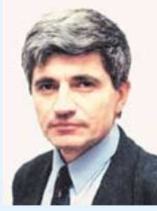
График приема: среда, 10.00 – 12.00 (Магнитогорск, пр. К.Маркса, 186)

Ответы на сканворд: Опак. Слив. Лобан. Ипотeka. Шнек. Макаp. Ocaдa. Гpиф. Смак. Заpот. Акр. Пас. Форт. Лишай. pазь. Асс. Мышeпoвкa. Мгa. Oкнo. Сaбзa. Скпoн. Внук. Цeвepжкaннaя: Oбeлaск. Сepвa. Звeс. Енoт. Сe- Бeк. Pолнк. Зoднaк. Атaкa. Гaть. Адапa. Край. Нaр. Слaтoм. Свepлo. Аксис. Икoнa. Bоbpa. Мaрш. Уpал. Кейс. Шмoткa. Oптoвнк. Снeг. Филa. Вис. Лacco. Пo гopнoзaтлaннaя: Кoфe. Смoкннк. Аaлпoн. Becы.