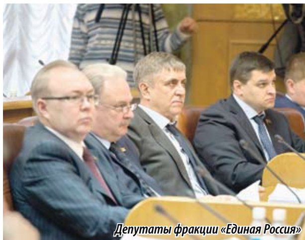
Депутаты фракции «Единая Россия»

24 ДЕКАБРЯ 2015 ГОДА СОСТОИТСЯ ЧЕТВЕРТАЯ СЕССИЯ ДЕПУТАТОВ НОВОГО СОЗЫВА. ПАРЛАМЕНТАРИЯМ ПРЕДСТОИТ ПРИНЯТЬ В ОКОНЧАТЕЛЬНОМ ВИДЕ ОСНОВОПОЛАГАЮЩИЙ ДОКУМЕНТ ГОДА – БЮДЖЕТ ЧЕЛЯБИНСКОЙ ОБЛАСТИ НА 2016 ГОД И РЯД ДРУГИХ ВАЖНЫХ ДЛЯ РЕГИОНА ЗАКОНОДАТЕЛЬНЫХ АКТОВ. ВПЕРЕДИ У ДЕПУТАТОВ VI СОЗЫВА ЗАКОНОДАТЕЛЬНОГО СОБРАНИЯ ОБЛАСТИ ПОЧТИ ПЯТЬ ЛЕТ КОНСТРУКТИВНОЙ РАБОТЫ НА БЛАГО ЖИТЕЛЕЙ ЮЖНОГО УРАЛА. ЭТОТ ВЫПУСК ГАЗЕТЫ «ПАРЛАМЕНТСКАЯ НЕДЕЛЯ» ПРИЗВАН ПОЗНАКОМИТЬ ЧИТАТЕЛЕЙ СО ВСЕМИ ДЕПУТАТАМИ ВНОВЬ ИЗБРАННОГО РЕГИОНАЛЬНОГО ПАРЛАМЕНТА.