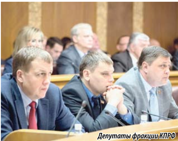
Депутаты фракции КПРФ