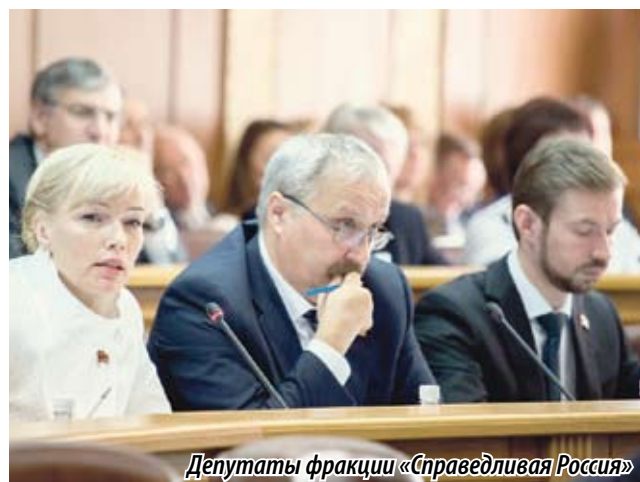
Депутаты фракции «Справедливая Россия»