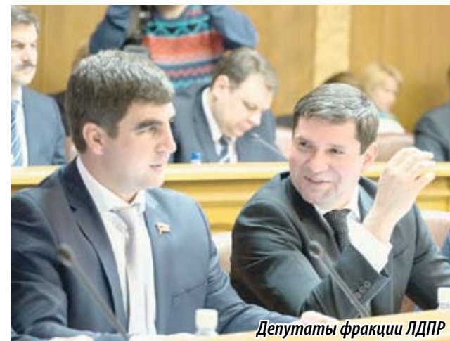
Депутаты фракции ЛДПР