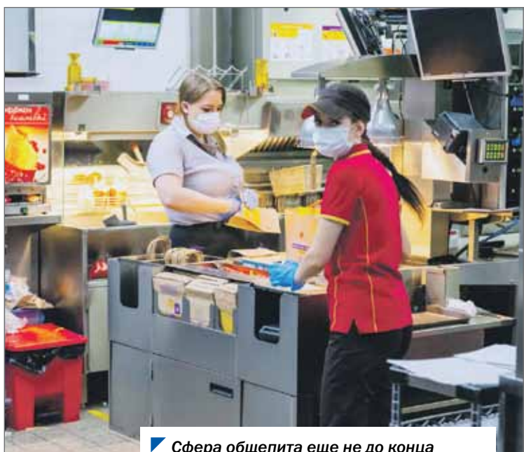
Сфера общепита еще не до конца восстановилась от последствий пандемии.