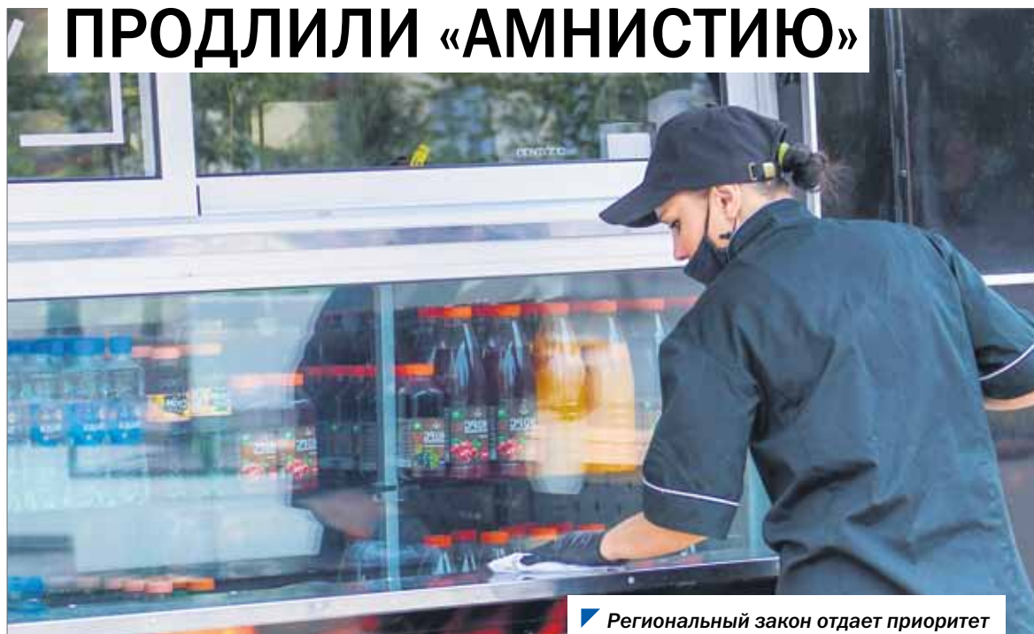
Региональный закон отдает приоритет добросовестным владельцам НТО.

В 2021 году южноуральские парламентарии продолжали работу над совершенствованием положений областного закона о размещении нестационарных торговых объектов. Одной из последних и главных инициатив стало продление «амнистии» по НТО до 1 июля 2022 года.