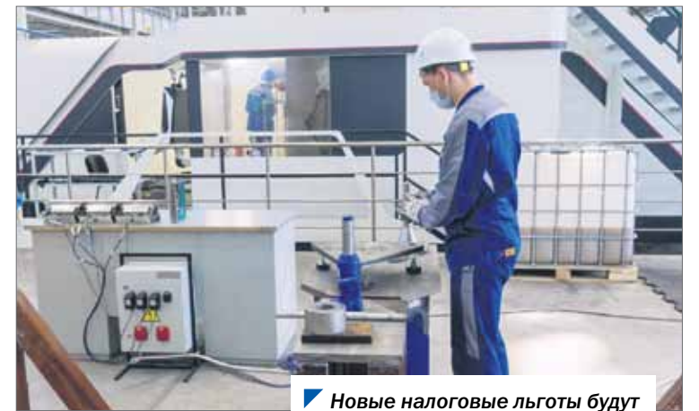
Новые налоговые льготы будут востребованы технопарками.

Особая экономическая зона как территория с льготным налоговым и таможенным режимом — один из инструментов повышения эффективности региональной экономики. Он дает такие возможности, как создание новых рабочих мест, развитие экспортной базы, обеспечение импортозамещения.