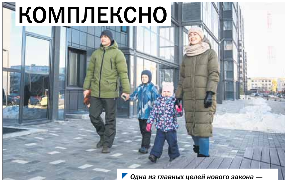
Одна из главных целей нового закона — формирование комфортной городской среды.

Отметим, если федеральный закон предусматривает широкий перечень критериев, касающихся и ветхоаварийного жилья, и нежилой застройки, то региональный документ регламентирует процессы застройки конкретно в Челябинской области.