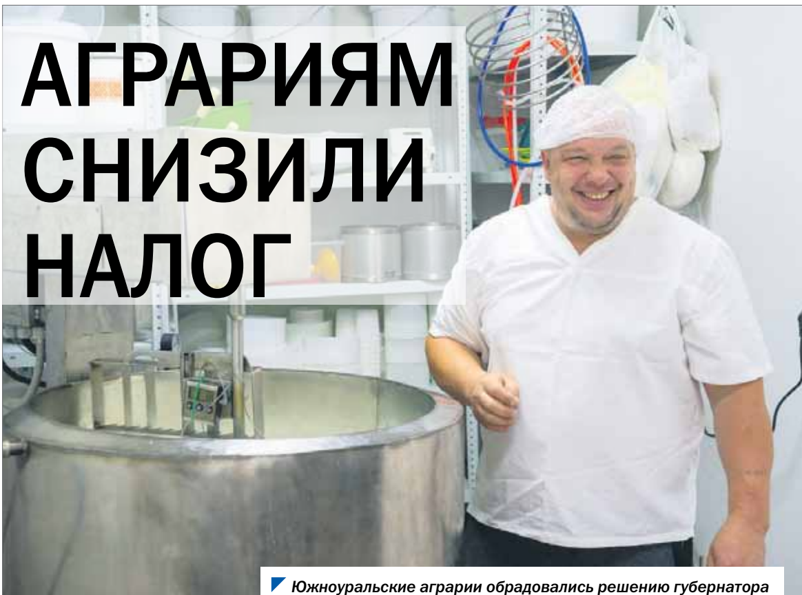
Южноуральские аграрии обрадовались решению губернатора и Законодательного Собрания снизить ставку сельхозналога.

В июне областные парламентарии поддержали инициативу губернатора Алексея Текслера о снижении в регионе ставки единого сельхозналога в два раза — с 6 до 3% — на два года, начиная с текущего года. Это позволит южноуральским аграриям направить высвободившиеся средства на развитие. Мы посетили несколько крестьянских (фермерских) хозяйств, чтобы узнать реакцию на принятый закон.