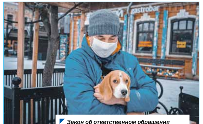
Закон об ответственном обращении с животными продолжают совершенствовать.

В течение 2021 года депутаты неоднократно вносили