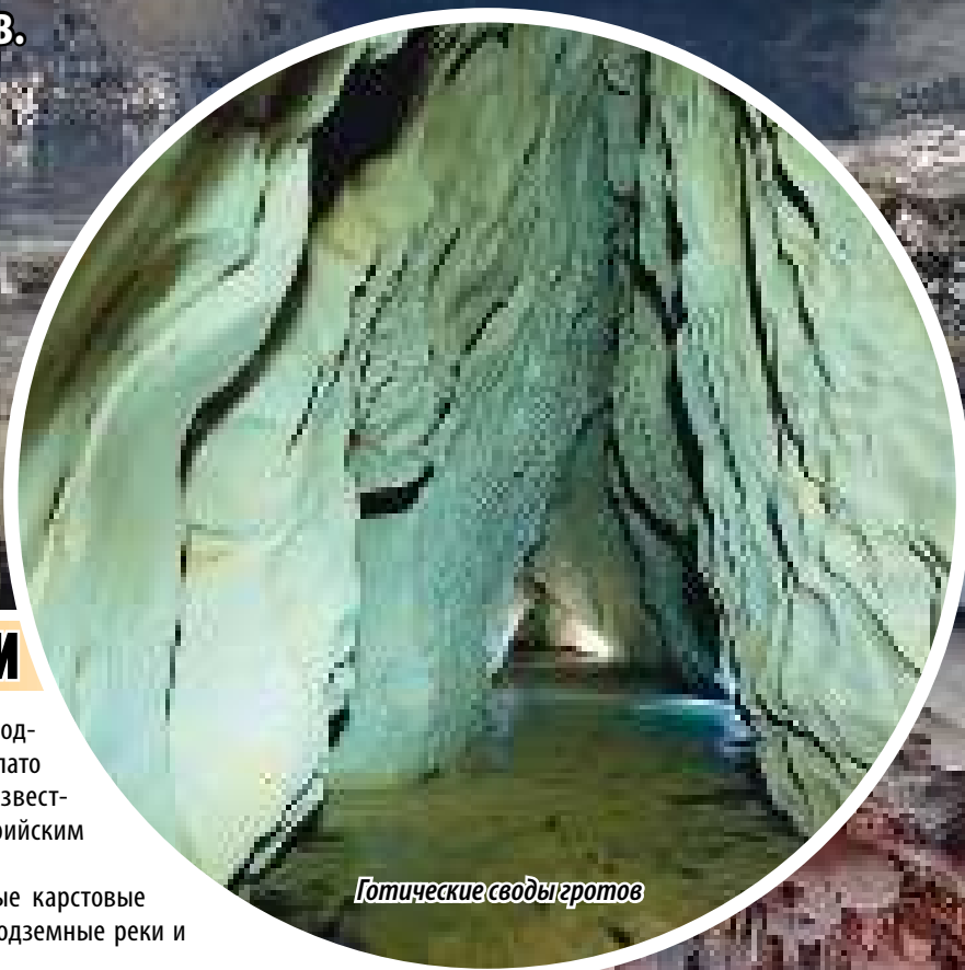
Готические своды гротов