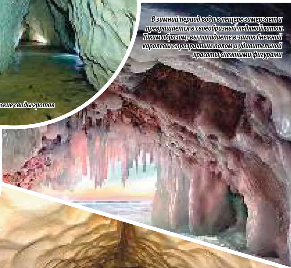
В зимний период вода в пещере замерзает и превращается в своеобразный ледяной каток. Таким образом, вы попадаете в замок Снежной королевы с прозрачным полом и удивительной красотой снежными фигурами