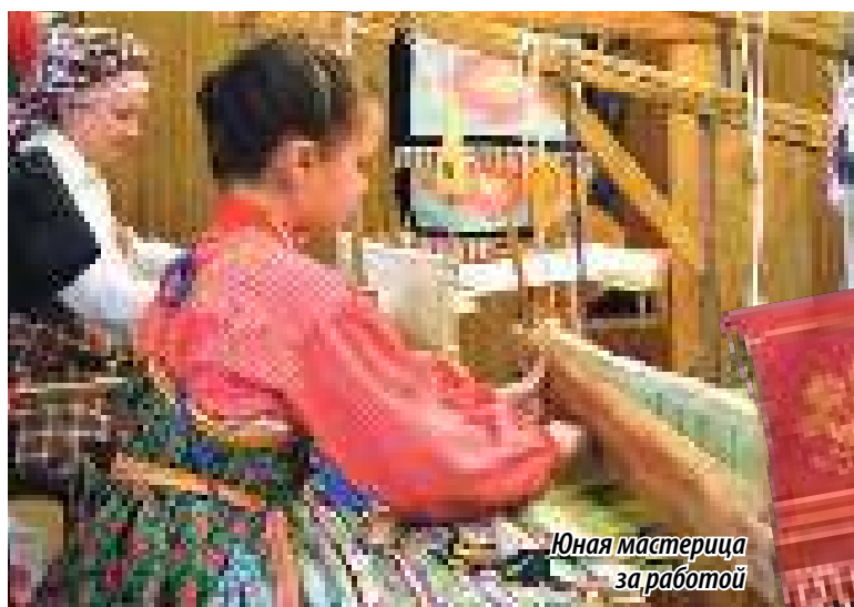
Юная мастерица за работой