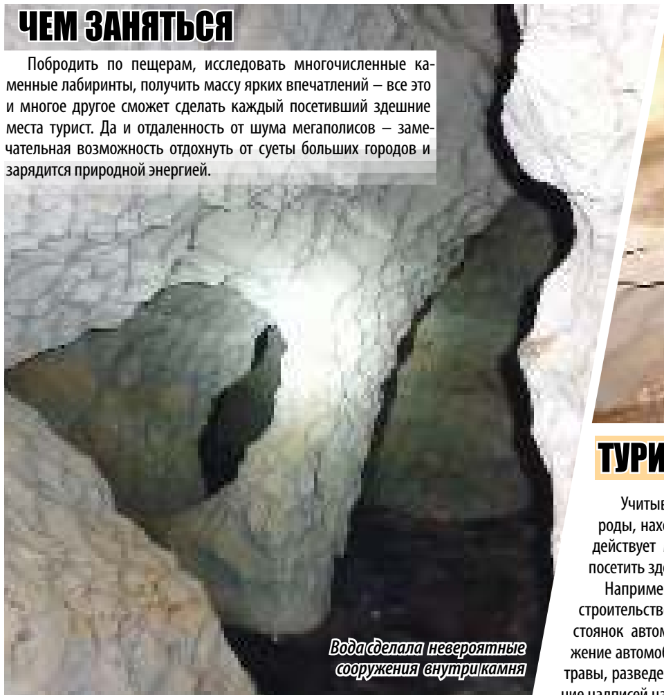
Вода сделала невероятные сооружения внутри камня

Побродить по пещерам, исследовать многочисленные каменные лабиринты, получить массу ярких впечатлений – все это и многое другое сможет сделать каждый посетивший здешние места турист. Да и отдаленность от шума мегаполисов – замечательная возможность отдохнуть от суеты больших городов и зарядиться природной энергией.