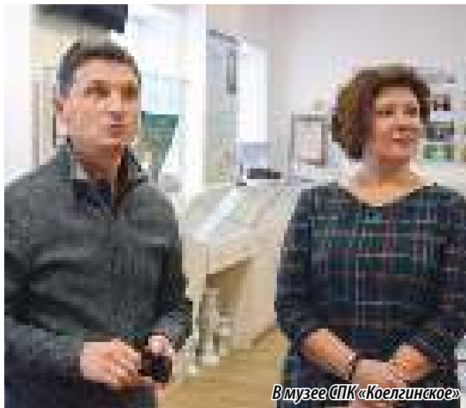
В музее СПК «Коелгинское»

С нашей стороны помощь сельской жительнице не просто разовый жест доброй воли. СПК «Коелгинское» традиционно выделяет много средств на благотворительность. В частности, в селе Коелга давно работает детский центр «Радуга», известный по всей России. Но раньше центр ютился в нескольких небольших помещениях. Несколько лет назад СПК принял решение передать бесплатно «Радуге» одно из своих помещений, а именно бывшую двухэтажную контору. При поддержке района был сделан хороший ремонт, и сейчас это большое, светлое здание. Благотворительность не может быть разовой акцией. Этим необходимо заниматься, поскольку бизнес, безусловно, несет социальную ответственность.