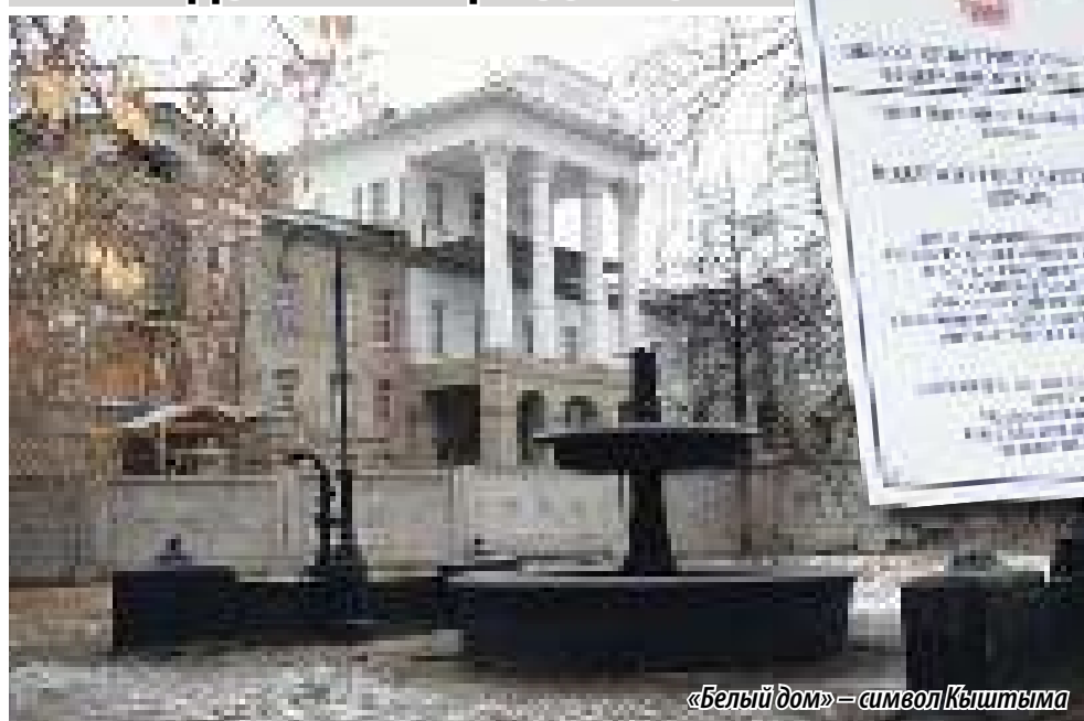
«Белый дом» – символ Кыштыма