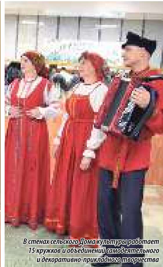
В стенах сельского Дома культуры работает 15 кружков и объединений самодельного и декоративно-прикладного творчества