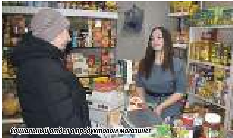
Социальный отдел в продуктовом магазине

В поселке Новогорном в пилотном режиме реализуется проект социального магазина. Инициатива разработана совместно с депутатом Государственной Думы Виталием Пашиним на фоне обращений граждан социально незащищенных категорий. Сегодняшний визит показал, что это на самом деле востребовано, это работает, люди очень рады. В замыслах – реализовать такой проект на постоянной основе. Более того, планируется развивать его и территориально, чтобы подобные социальные магазины работали и в других городах Челябинской области. Помимо этого, сегодня ко мне как к депутату поступили обращения от граждан. Вопросы будем рассматривать в оперативном порядке и принимать меры.