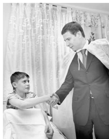
▲ Губернатор Михаил Юревич посетил пострадавших от ЧП

Всего за пятницу и два выходных дня в травмпункт обратилось 90 челябинцев, пострадавших от проделок метеорита. Еще один запоздалый па-