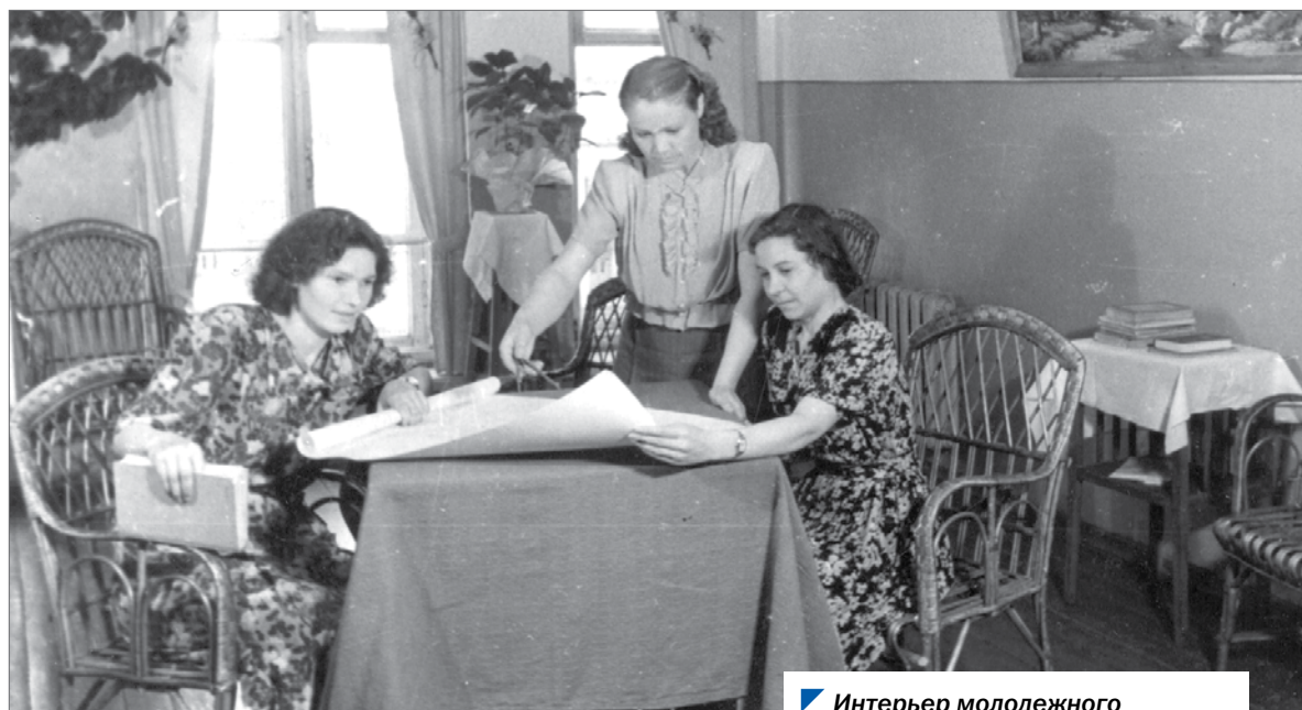
Интерьер молодежного общежития рабочих ЧТЗ, 1950-е гг.

Оттепель навсегда будет отмечена в отечественной истории как время подъема культурной деятельности общества. То, что происходило на Первом областном фестивале молодежи и студентов в Челябинске, — еще одно тому доказательство.