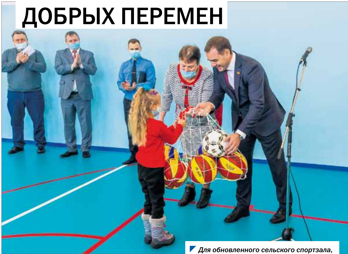
Для обновленного сельского спортзала, безусловно, нужны и новые мячи.