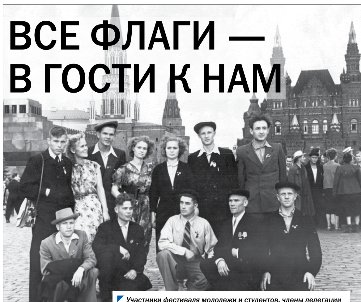
Участники фестиваля молодежи и студентов, члены делегации г. Троицка Челябинской области, 1956 г.

Областная эстафета стартовала 1 января и завершилась 18 марта 1957 года. После ее окончания рапорты участников передавались в областной центр, где и происходил непосредственный отбор участников.