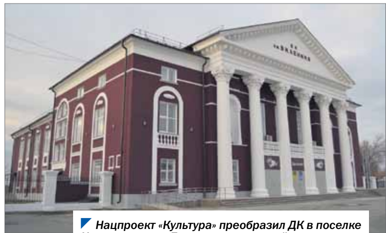
Нацпроект «Культура» преобразил ДК в поселке Красногогорском Еманжелинского района.

Реализацию национального проекта обсудил комитет по молодежной политике, культуре и спорту.