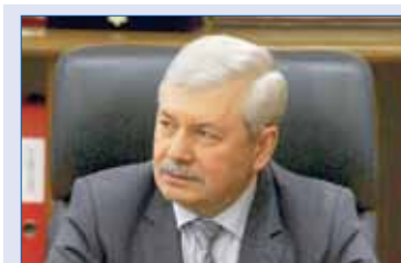
Владимир МЯКУШ, председатель Законодательного Собрания Челябинской области (фракция «Единая Россия»):

В экономическом блоке отметим закон, наделяющий органы местного самоуправления правом устанавливать понижающий коэффициент при выделении земельных участков для туристической индустрии. Это решение про-