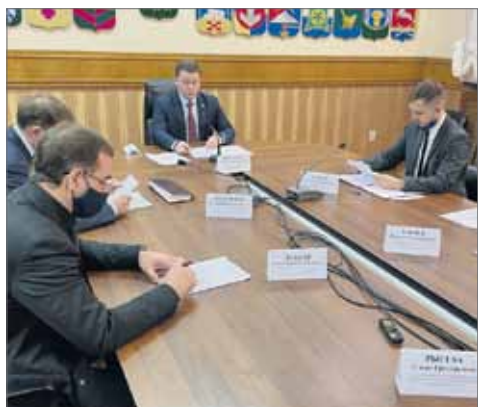
Совещание провел вице-спикер парламента Вадим Ромасенко.

В Челябинской области из-за пандемии в два раза сократилось количество проданных билетов на междугородние рейсы. Проблемы в указанной сфере обсудили в Законодательном Собрании.