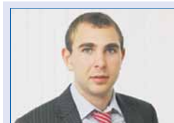
Михаил ВИДГОФ, председатель комитета по молодежной политике, культуре и спорту (фракция «Единая Россия»):

Южно-Уральский государственный институт искусств имени П.И. Чайковского и Миасский государственный колледж искусств и культуры. Капитальный ремонт получат 10 культурно-досуговых учреждений, а также семь детских школ искусств — в Копейске, Магнитогорске, Челябинске (2 учреждения), Южноуральске, Варненском и Еманжелинском районах. В Ашинском и Саткинском районах откроют два виртуальных концертных зала.