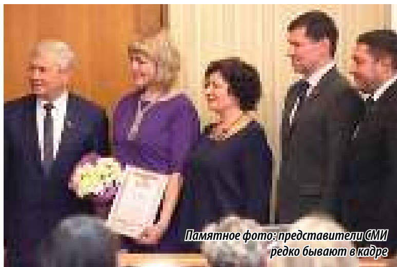
Памятное фото: представители СМИ редко бывают в кадре