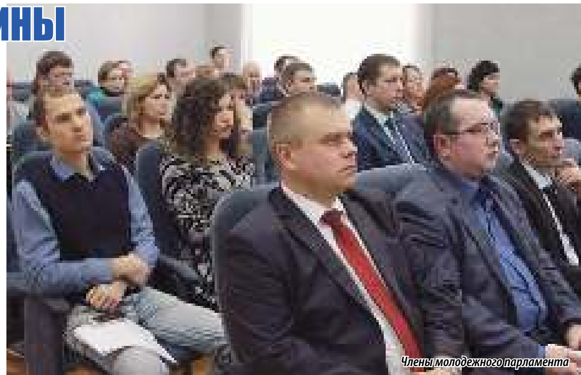
Члены молодежного парламента