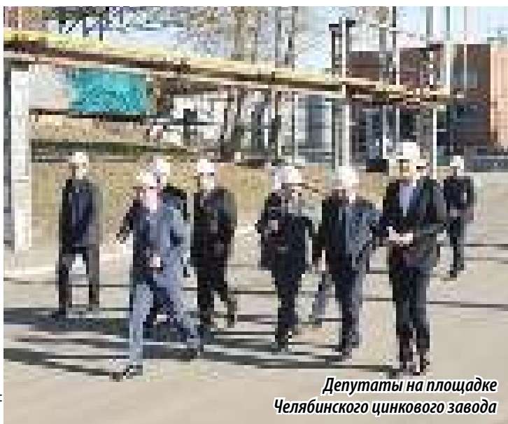
Депутаты на площадке Челябинского цинкового завода