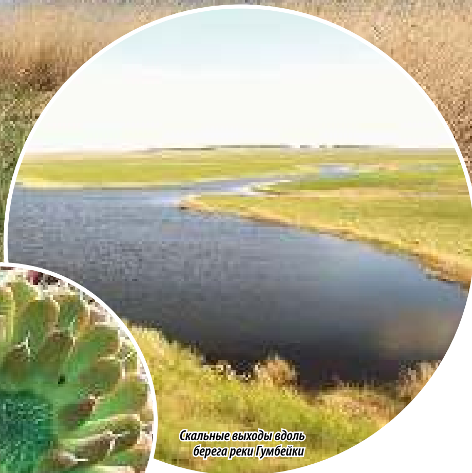
Скальные выходы вдоль берега реки Гумбейки