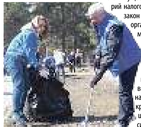
Подготовил Александр Патритеев.

«Указом президента Владимира Владимировича Путина 2017 год был объявлен в России Годом экологии. Хочу отметить, что Законодательное Собрание Челябинской области совместно с губернатором и правительством приняли в этом году ряд важных решений экологической направленности. Приведу только один пример, тем более что сегодня он особенно актуален для нашего региона. Это принятый в третьем чтении на декабрьском заседании Законодательного Собрания областной закон «О внесении изменений в Закон Челябинской области «О налоге на имущество организаций», предусматривающий установление налоговых льгот в отношении движимого имущества для отдельных категорий налогоплательщиков. В частности, закон предоставляет льготу для организаций, осуществляющих мероприятия по снижению негативного влияния на окружающую среду. Все это призвано послужить для крупных предприятий дополнительной мотивацией и в полной мере соответствует нашему стремлению увязать крупный бизнес с улучшением экологической ситуации в регионе.»