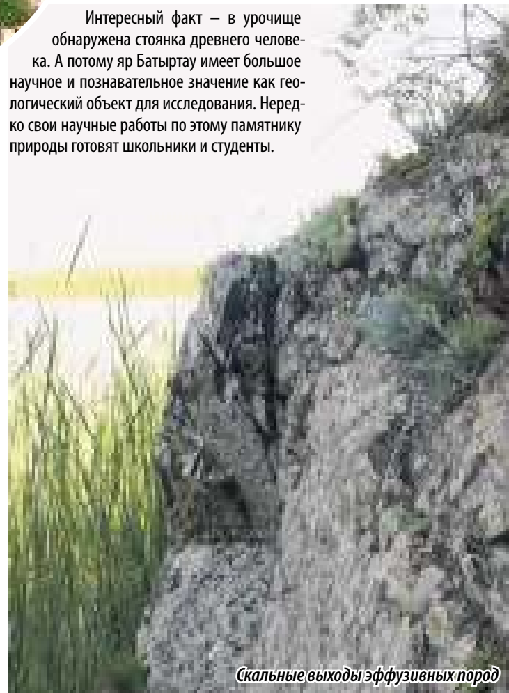
Скальные выходы эффузивных пород

Интересный факт – в урочище обнаружена стоянка древнего человека. А потому яр Батыртау имеет большое научное и познавательное значение как геологический объект для исследования. Нередко свои научные работы по этому памятнику природы готовят школьники и студенты.