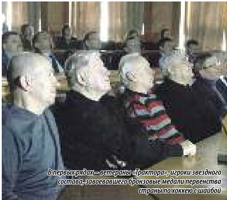
В первых рядах – ветераны «Трактора», игроки звездного состава, завоевавшего бронзовые медали первенства страны по хоккею с шайбой

В 1947 ГОДУ НА ХОККЕЙНОМ НЕБОСКЛОНЕ СТРАНЫ ЗАЖГЛАСЬ ЗВЕЗДА ЧЕЛЯБИНСКОГО «ТРАКТОРА». 30 ЛЕТ СПУСТЯ, В 1977 ГОДУ, ЛЕДОВАЯ ДРУЖИНА ИЗ ЮЖНОУРАЛЬСКОЙ СТОЛИЦЫ ДОБИЛАСЬ ПЕРВОГО ЗНАЧИТЕЛЬНОГО УСПЕХА В СВОЕЙ ИСТОРИИ, СТАВ БРОНЗОВЫМ ПРИЗЕРОМ ЧЕМПИОНАТА СССР. В ДЕКАБРЕ 2017 ГОДА, ЧЕРЕЗ 40 ЛЕТ ПОСЛЕ НЕЗАБЫВАЕМОЙ ПОБЕДЫ, В СТЕНАХ ЗАКОНОДАТЕЛЬНОГО СОБРАНИЯ СОСТОЯЛСЯ ПРЕДПРЕМЬЕРНЫЙ ПОКАЗ ДОКУМЕНТАЛЬНОГО ФИЛЬМА, ПОСВЯЩЕННОГО 70-ЛЕТНЕМУ ЮБИЛЕЮ ЧЕЛЯБИНСКОГО ХОККЕЯ.