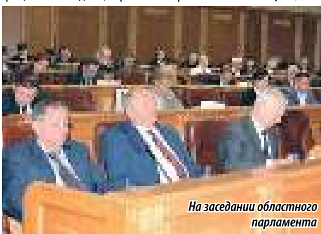
На заседании областного парламента

санитарно-эпидемиологическим требованиям. Для этого принята государственная программа «Охрана окружающей среды Челябинской области» на 2018 – 2025 годы с подпрограммой «Организация системы обращения с отходами производства и потребления на территории Челябинской области». В нее включены мероприятия по созданию объектов обращения с ТКО, проектированию и рекультивации мест размещения ТКО и др.