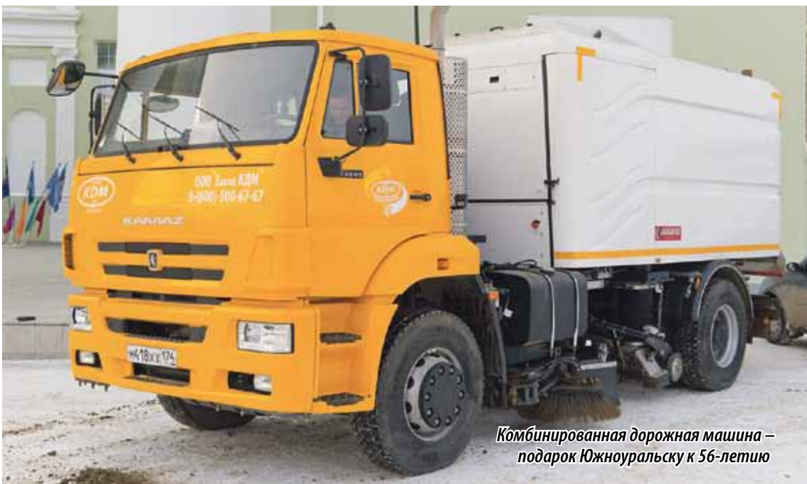
Комбинированная дорожная машина – подарок Южноуральску к 56-летию

«Всегда приятно приезжать в города, в которых заметны изменения. Позитивные перемены в Южноуральске, уверен, продолжатся. Буквально накануне губернатором Челябинской области Борисом Дубровским подписано распоряжение о выделении 1 миллиарда рублей на программу «Реальные дела» в 2019 году, в том числе 15,5 миллиона – для Южноуральска. Важно, чтобы обсуждение объектов, которые войдут в программу на этот год, проходило с участием всех горожан.»