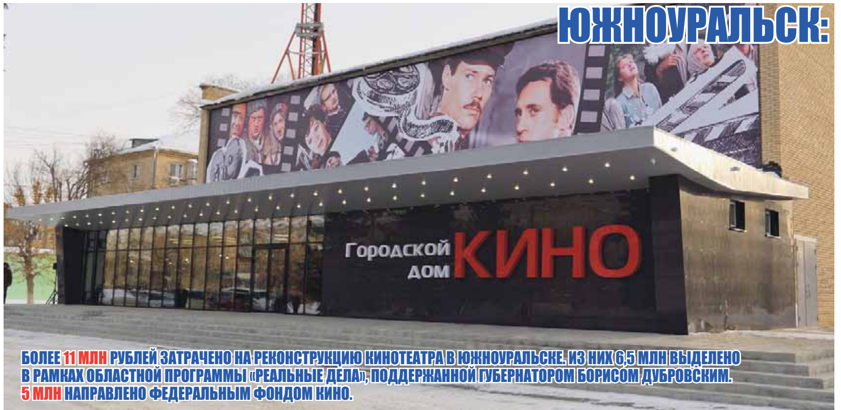
БОЛЕЕ 11 МЛН РУБЛЕЙ ЗАТРАЧЕНО НА РЕКОНСТРУКЦИЮ КИНОТЕАТРА В ЮЖНОУРАЛЬСКЕ. ИЗ НИХ 6,5 МЛН ВЫДЕЛЕНО В РАМКАХ ОБЛАСТНОЙ ПРОГРАММЫ «РЕАЛЬНЫЕ ДЕЛА», ПОДДЕРЖАННОЙ ГУБЕРНАТОРОМ БОРИСОМ ДУБРОВСКИМ. 5 МЛН НАПРАВЛЕНО ФЕДЕРАЛЬНЫМ ФОНДОМ КИНО.

ГОРОДАМИ НЕ РОЖДАЮТСЯ, ГОРОДАМИ СТАНОВЯТСЯ. И В БОЛЬШЕЙ СТЕПЕНИ ЭТО ОТНОСИТСЯ К ТЕМ ИЗ НИХ, КТО НЕ СТОИТ НА МЕСТЕ, АКТИВНО РАЗВИВАЯСЬ ВО ВСЕХ НАПРАВЛЕНИЯХ И ПРЕОБРАЖАЯСЬ В ЦЕЛОМ. САМЫЙ МОЛОДОЙ ГОРОД ЧЕЛЯБИНСКОЙ ОБЛАСТИ ЮЖНОУРАЛЬСК В НАЧАЛЕ ФЕВРАЛЯ ОТМЕТИЛ 56-ЛЕТИЕ СО ДНЯ ПРИСВОЕНИЯ ЕМУ СТАТУСА ГОРОДСКОГО ФОРМИРОВАНИЯ. К ЭТОМУ СОБЫТИЮ БЫЛ ПРИУРОЧЕН РАБОЧИЙ ВИЗИТ ПРЕДСЕДАТЕЛЯ ЗАКОНОДАТЕЛЬНОГО СОБРАНИЯ ВЛАДИМИРА МЯКУША, ЕГО ЗАМЕСТИТЕЛЯ МАРИНЫ ПОДДУБНОЙ (ОБА – ФРАКЦИЯ «ЕДИНАЯ РОССИЯ»), А ТАКЖЕ ВИЦЕ-ГУБЕРНАТОРА ЕВГЕНИЯ ГОЛИЦЫНА.