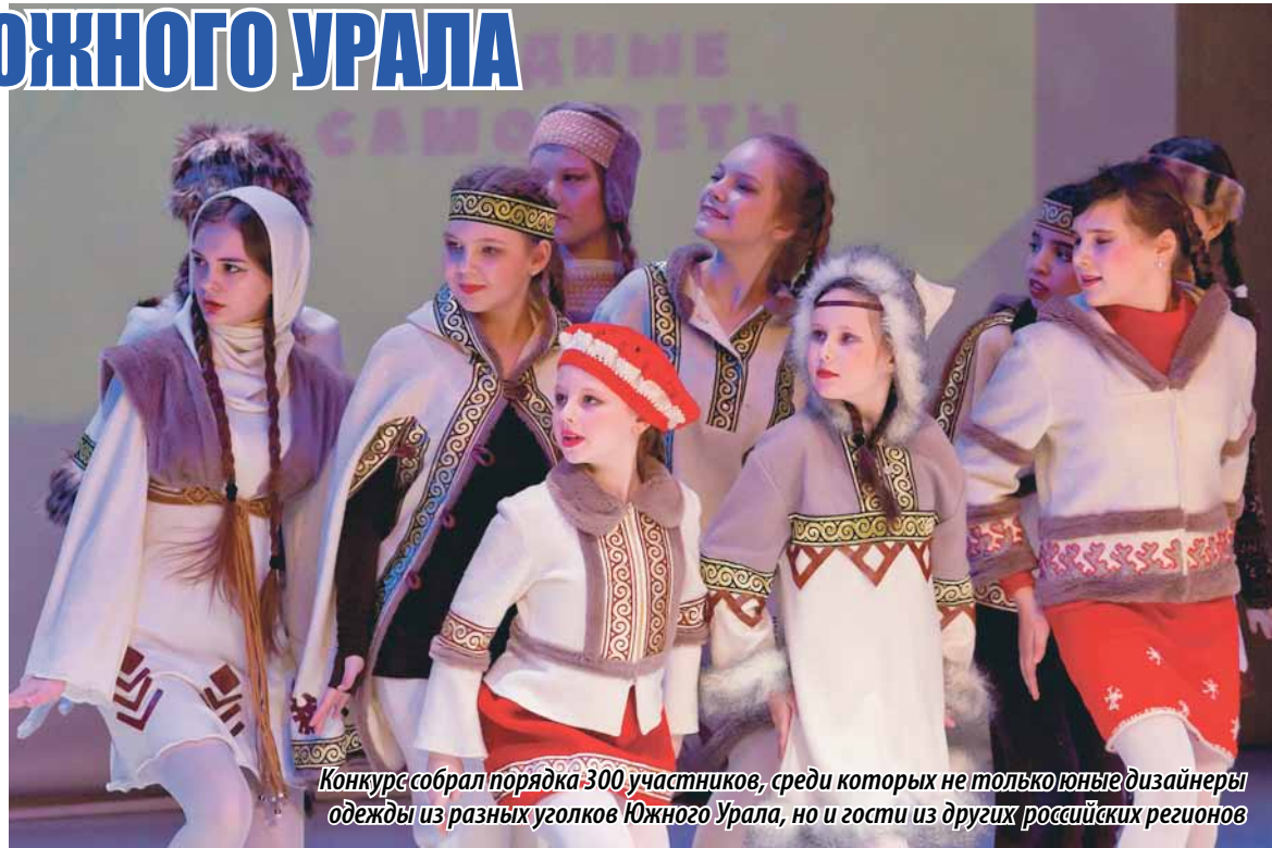
Конкурс собрал порядка 300 участников, среди которых не только юные дизайнеры одежды из разных уголков Южного Урала, но и гости из других российских регионов

– То, что конкурс уже вышел за пределы Челябинской области говорит о том, что наш край славится не только своей металлургией, станкостроени-