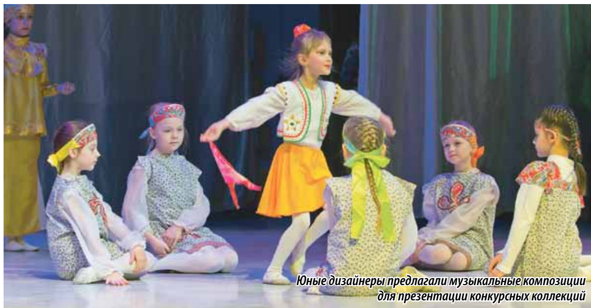
Юные дизайнеры предлагали музыкальные композиции для презентации конкурсных коллекций

Теперь победителям предстоит соревноваться в модном конкурсе федерального уровня. Предполагается, что он состоится в Москве уже этой весной.