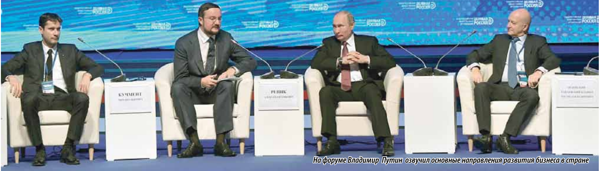
На форуме Владимир Путин озвучил основные направления развития бизнеса в стране