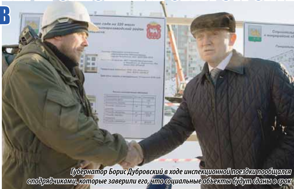
Губернатор Борис Дубровский в ходе инспекционной поездки общается с подрядчиками, которые заверили его, что социальные объекты будут сданы в срок

Глава региона осмотрел ход строительных работ детского сада в микрорайоне № 1 по улице Зальцмана. В трехэтажном здании расположится 12 групп, одна из которых рассчитана на детей от