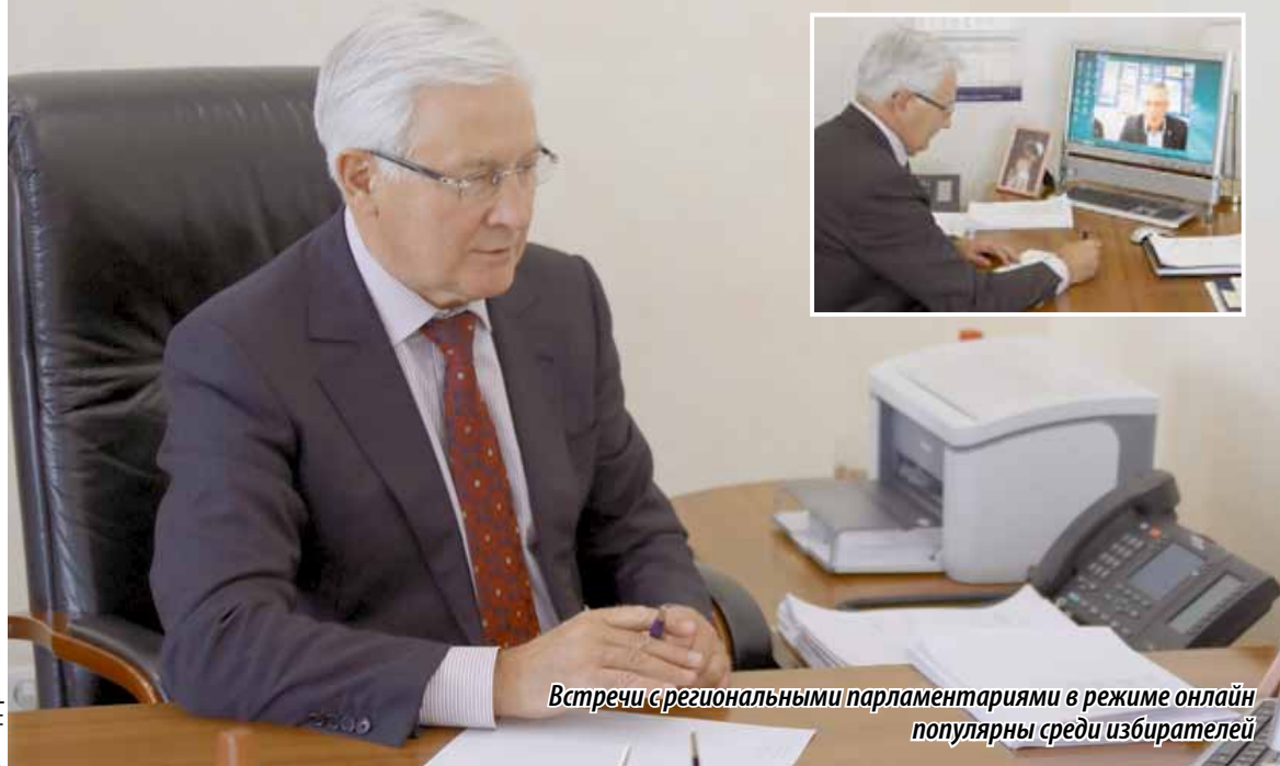
Встречи с региональными парламентариями в режиме онлайн популярны среди избирателей

СОВРЕМЕННЫЕ ТЕХНОЛОГИИ НЕ РЕДКО ПОМОГАЮТ В РАБОТЕ, ДЕЛАЮТ ЕЕ ПРОДУКТИВНЕЕ И СПОСОБСТВУЮТ ОПЕРАТИВНОСТИ. ИМЕННО ПОЭТОМУ ДЕПУТАТЫ ЗАКОНОДАТЕЛЬНОГО СОБРАНИЯ ЧЕЛЯБИНСКОЙ ОБЛАСТИ НЕ БОЯТСЯ ПОЛЬЗОВАТЬСЯ СОВРЕМЕННЫМИ ТЕХНОЛОГИЯМИ, А НАОБОРОТ, АКТИВНО ИХ ВНЕДРЯЮТ В СВОЮ ПАРЛАМЕНТСКУЮ ДЕЯТЕЛЬНОСТЬ.