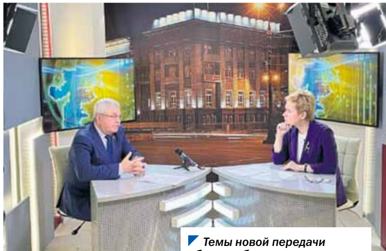
Темы новой передачи обещают быть резонансными.