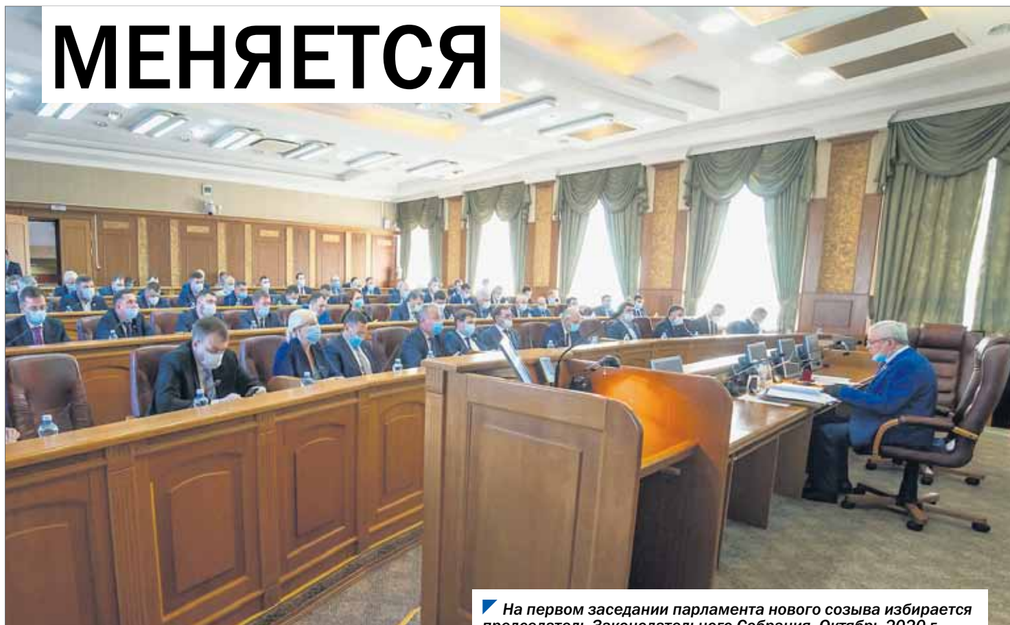
На первом заседании парламента нового созыва избирается председатель Законодательного Собрания. Октябрь 2020 г.

Депутаты седьмого созыва южноуральского парламента сегодня активно работают над изменениями в Регламенте Законодательного Собрания, совершенствуя порядок проведения заседаний, повышая открытость и прозрачность различных процедур. С самыми знаковыми из этих изменений знакомим в материале.