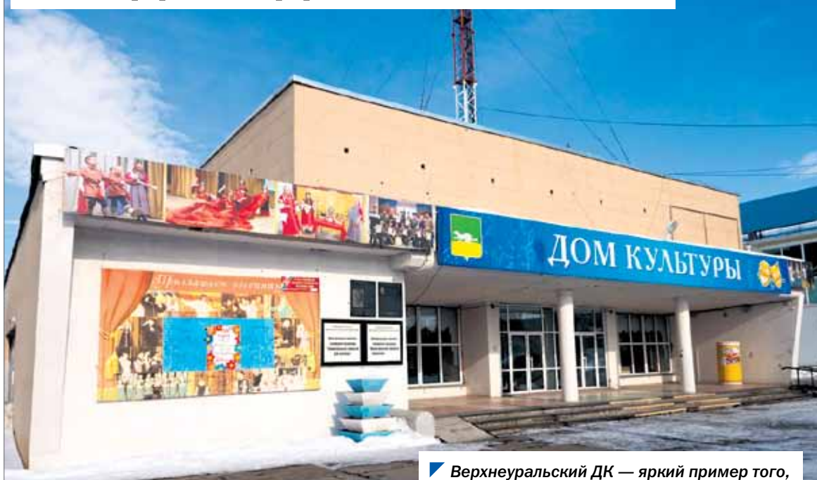
Верхнеуральский ДК — яркий пример того, как партпроект меняет учреждения культуры.