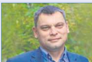
Михаил МАХОВ, председатель комитета Законодательного Собрания по экологии и природопользованию (фракция «Зеленая альтернатива»):

(из них более 1 млрд рублей — средства региона) составило финансирование рекультивации Челябинской свалки по проекту «Чистая страна».