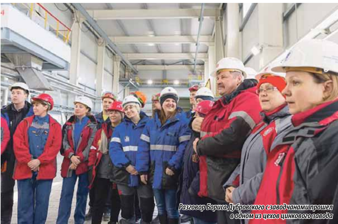
Разговор Бориса Дубровского с заводчанами прошел в одном из цехов цинкового завода