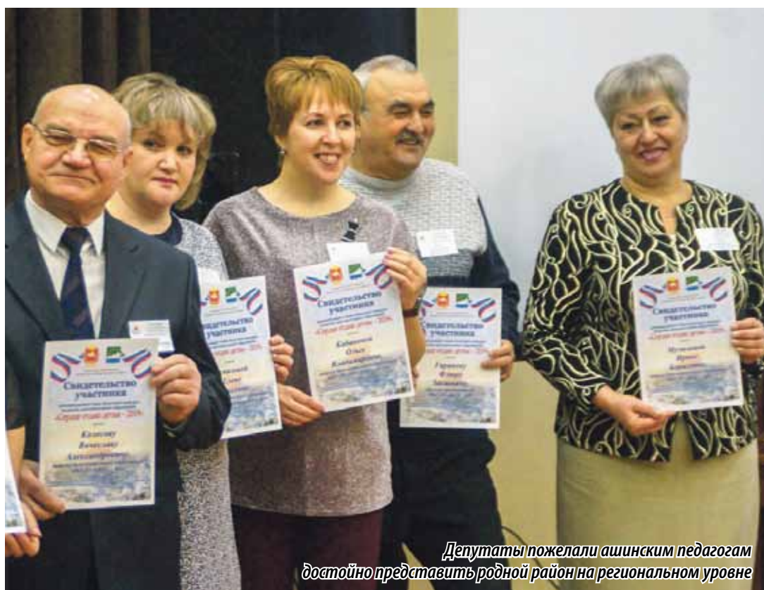
Депутаты пожелали ашинским педагогам достойно представить родной район на региональном уровне

Мероприятие проходило в течение трех дней. Участникам конкурса «Учитель года России» предстояло провести: «Мастер-класс», «Разговор с учащимися», «Учебное занятие с самоанализом», «Представление педагогического опыта», «Образовательный проект» и «Круглый стол образовательных политиков». В свою очередь участники конкурса «Сердце отдаю детям» тоже в течение трех дней проходили конкурсные испытания: «Самопрезентация «Мое педагогическое кредо», «Защита дополнительной общеобразовательной общеразвивающей программы», «Ознакомительное занятие», а также поучаствовали в «Круглом столе образовательных политиков» совместно со своими коллегами по конкурсу «Учитель года России – 2019».