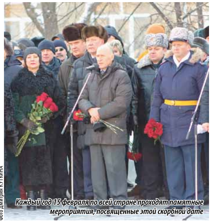
Каждый год 15 февраля по всей стране проходят памятные мероприятия, посвященные этой скорбной дате

«Несмотря на то что сегодня исполнилось 30 лет со дня вывода советских войск из Афганистана, до сих пор много споров среди политиков и историков, насколько участие в тех событиях было необходимо. Как бы там ни было, эта война навсегда изменила судьбы многих военнослужащих, которые принимали в ней участие, но многие из них нашли в себе силы вернуться к нормальной жизни. И сегодня они работают с детьми и подростками, огромное внимание уделяют военно-патриотическому воспитанию, строят карьеру. И такие мероприятия крайне важны, чтобы отдать дань памяти погибшим в той необъявленной войне.»