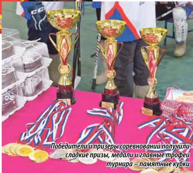
Победители и призеры соревнований получили сладкие призы, медали и главные трофеи турнира — памятные кубки

Первый год участвуем в турнире. В декабре прошлого года у нас начались тренировки. Условия для этого есть: на стадионе установлена современная хоккейная коробка, там и тренируемся, там и играем. Форма, клюшки, валенки. Что еще надо? Победа! Из четырех сегодняшних игр только один раз уступили соперникам. Наверное, и мой вклад в это есть, играю в центральном нападении. Не скажу, что все получается, но справляюсь.