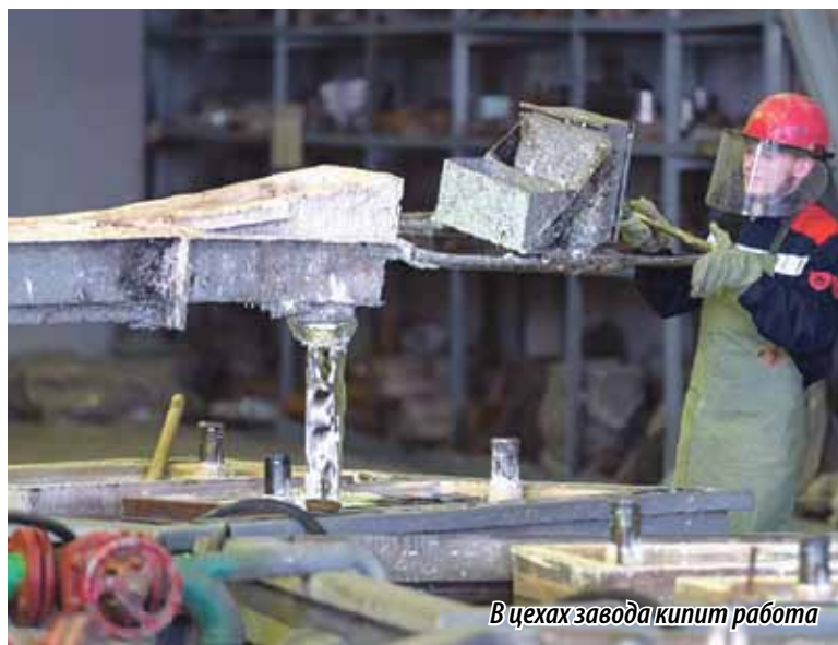
В цехах завода кипит работа

дят инвентаризацию и готовят полную информацию для расчета квот, чтобы показатели были реальны и не привели к приостановке деятельности. ЧЦЗ одним из первых предприятий Челябинска подписал соглашение о взаимодействии с правительством Челябинской области в сфере охраны окружающей среды. За последние 10 лет завод вложил в природоохранные мероприятия более 4 млрд рублей.