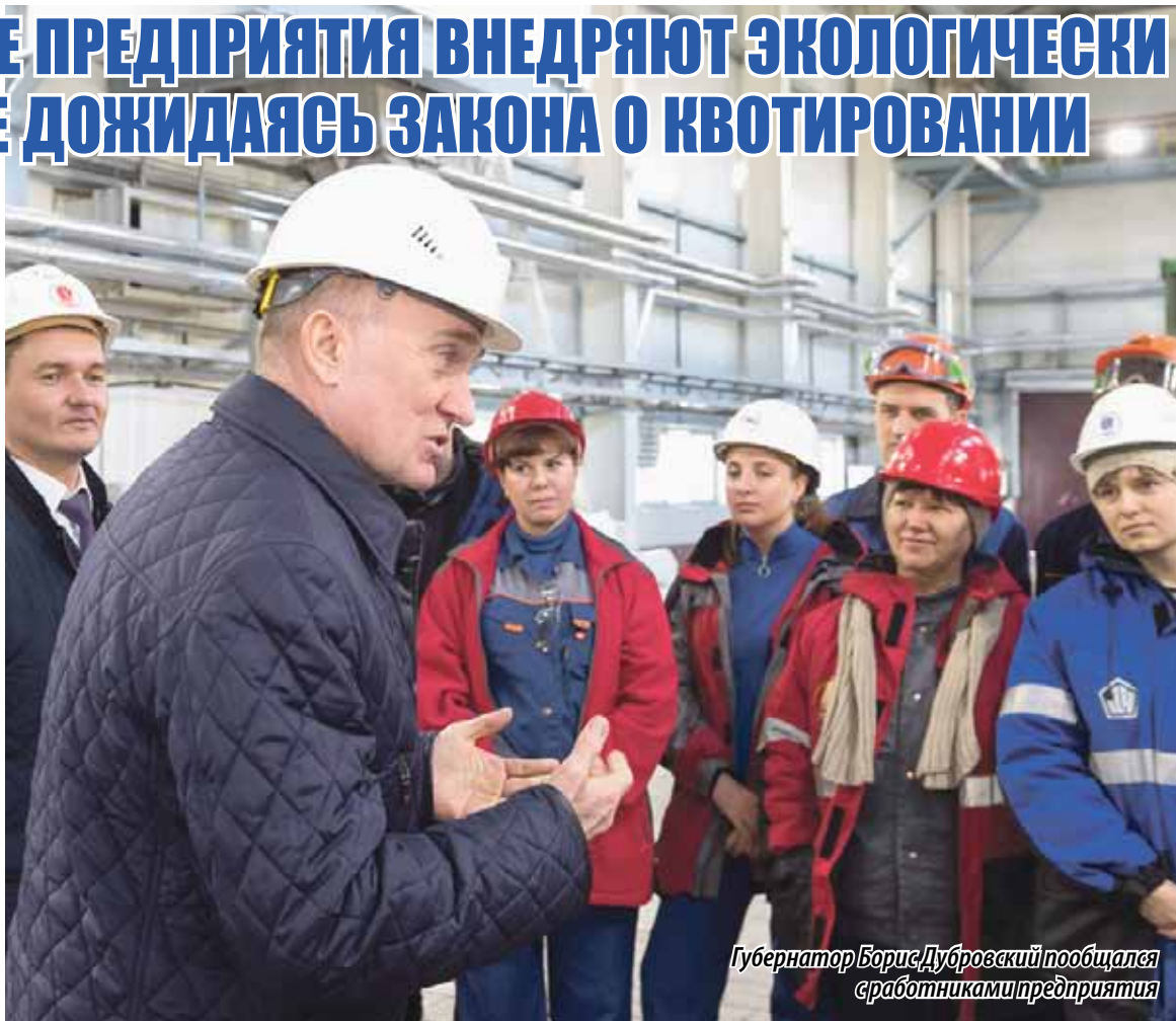
Губернатор Борис Дубровский пообщался с работниками предприятия

— Мы сейчас прорабатываем вопрос перехода транспорта на газомо-