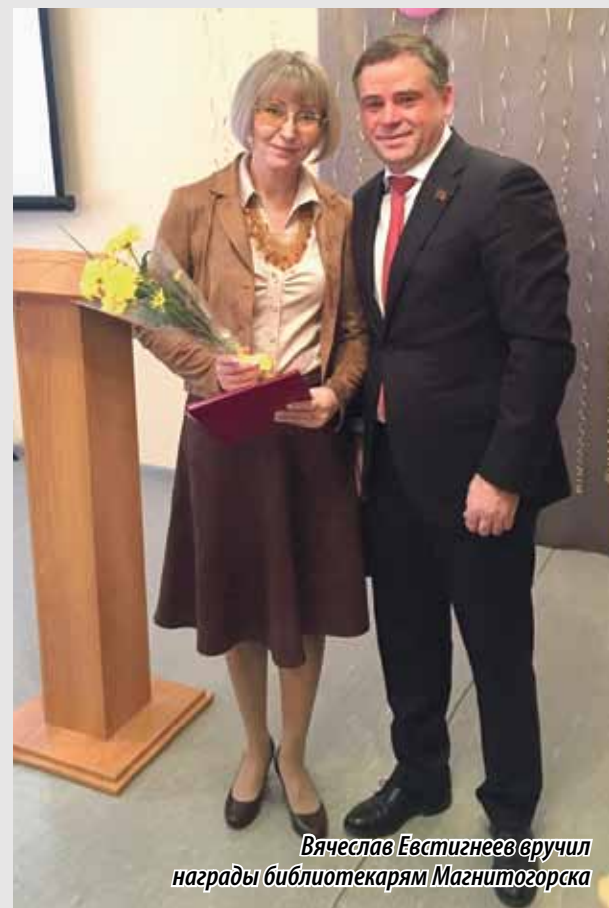
Вячеслав Евстигнеев вручил награды библиотекарям Магнитогорска

Обращаясь к библиотекарям, парламентарий отметил высокий вклад работников культуры в развитие подрастающего поколения: