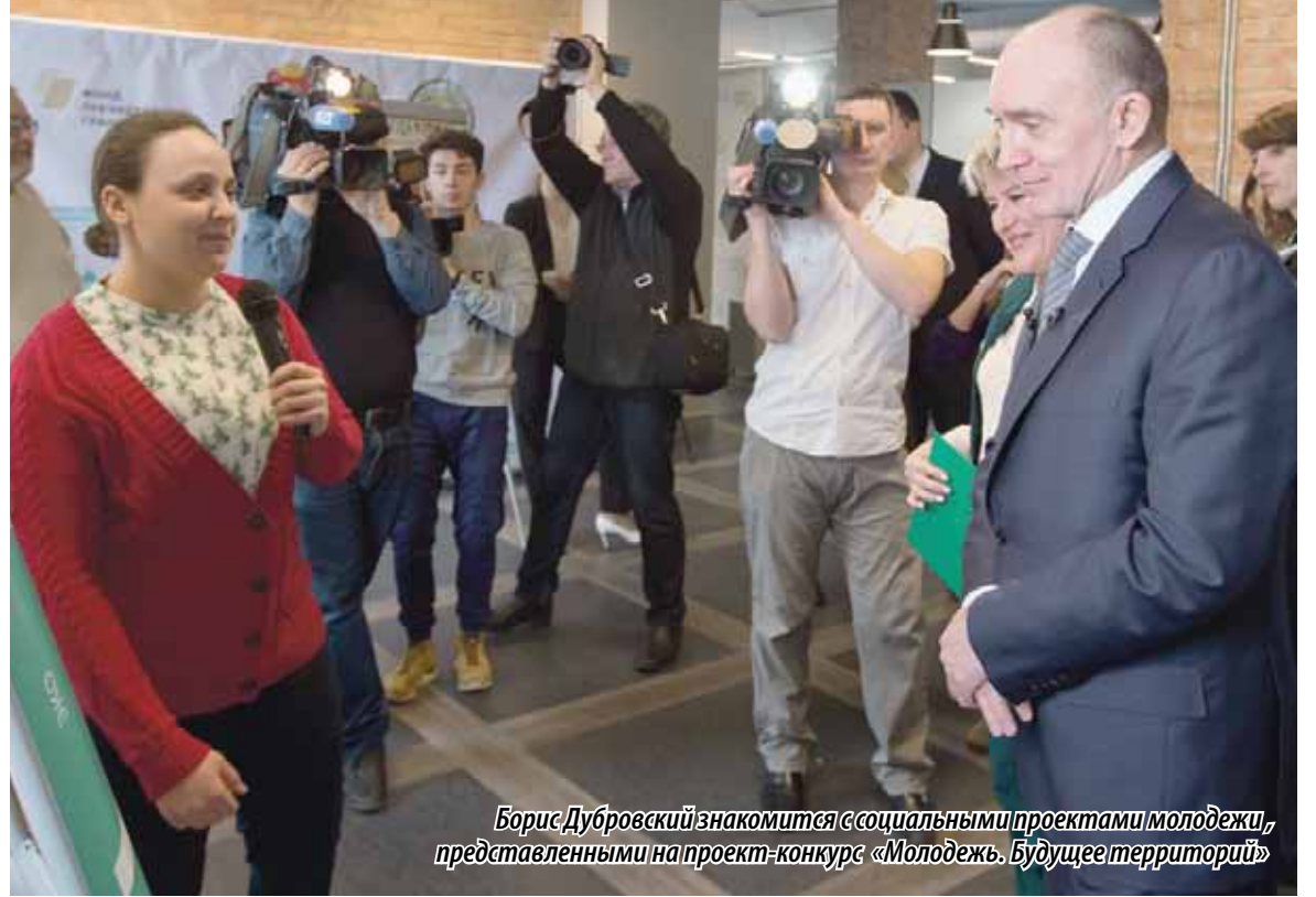
Борис Дубровский знакомится с социальными проектами молодежи, представленными на проект-конкурс «Молодежь. Будущее территорий»

— Все представленные инициативы интересны, но требуют детальной проработки. Уверен, что в процессе обучения и при помощи наставников они будут качественно оформлены и станут полезными для общества. Мне кажется, что благодаря конкурсу «Молодежь. Будущее территорий» мы сможем помочь кому-то осуществить мечту. Не стесняйтесь выступать с инициативой и подавать на конкурс проекты, мы готовы помогать, ждем ваших инициатив, — обо-