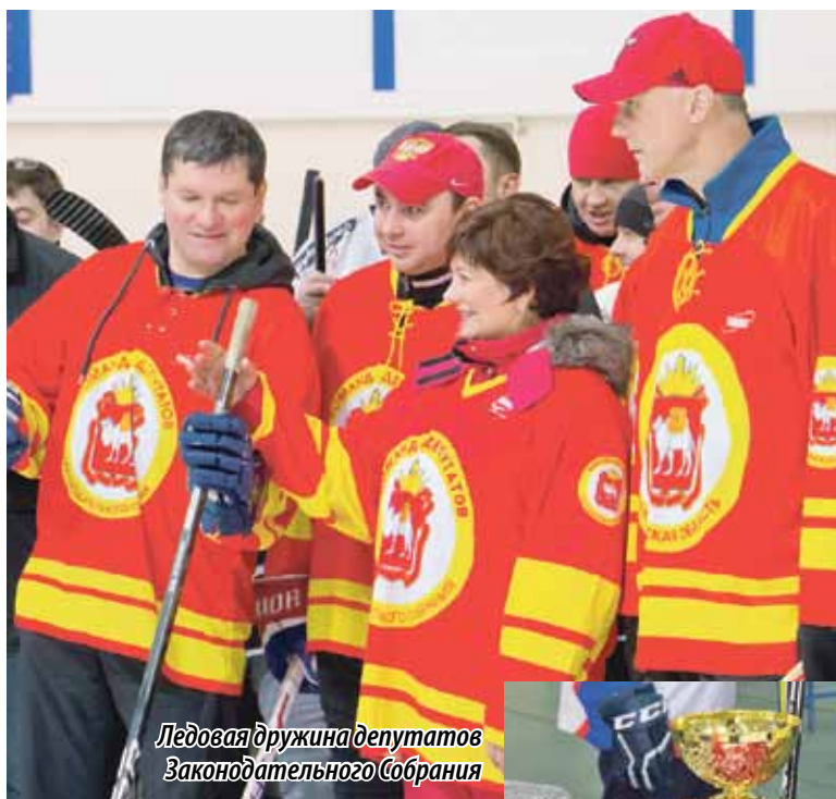
Ледовая дружина депутатов Законодательного Собрания

В первый раз участвуем в этом турнире. Обычно играем в хоккее на коньках, но здесь принцип тот же самый, только в валенках. А вообще, это же очень старая, давняя игра. Мне самому около 40 лет, но еще помню, как старшие ребята надевали валенки, брали клюшки и выходили во двор. Здорово, что сегодня эта игра возродилась для молодого поколения. Нашу команду собирали из мальчишек, живущих в разных поселениях. Да, команда сборная, так что будем присматриваться, менять тактику уже по ходу игры. Хотя сегодня для нас главное не победа, а участие, участие в таком престижном турнире.