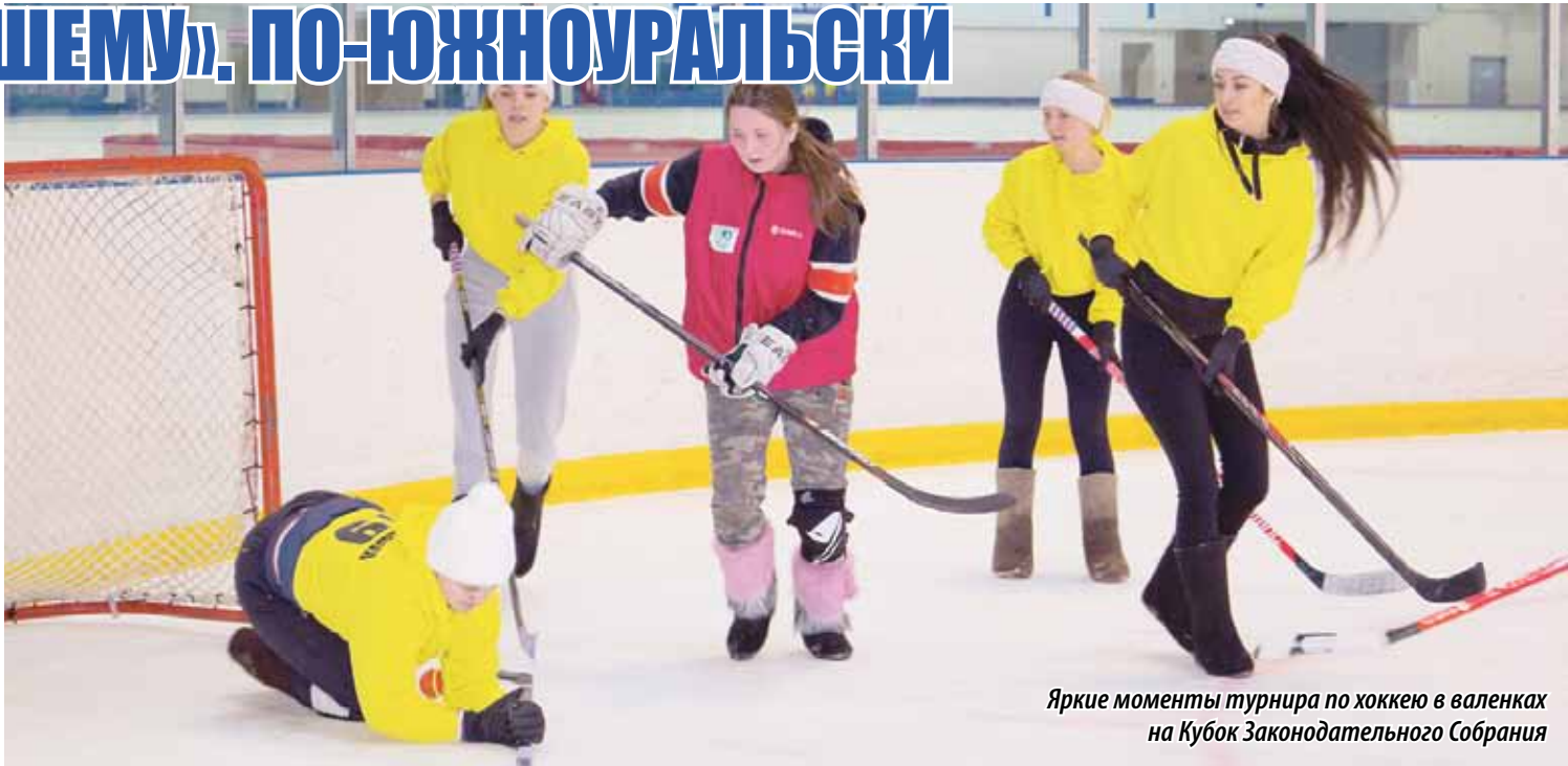
Яркие моменты турнира по хоккею в валенках на Кубок Законодательного Собрания

В ПРОШЛУЮ СУББОТУ ЛЕДОВЫЙ ДВОРЕЦ «УРАЛЬСКАЯ МОЛНИЯ» В ЧЕЛЯБИНСКЕ СТАЛ СЕРДЦЕМ НАРОДНОГО ХОККЕЯ. ПОРЯДКА ПОЛУСОТНИ КОМАНД — ЛУЧШИЕ ИЗ ЛУЧШИХ — СЪЕХАЛИСЬ СЮДА СО ВСЕГО ЮЖНОГО УРАЛА НА ФИНАЛЬНЫЕ ИГРЫ IX ТУРНИРА ПО ХОККЕЮ В ВАЛЕНКАХ НА КУБОК ЗАКОНОДАТЕЛЬНОГО СОБРАНИЯ ЧЕЛЯБИНСКОЙ ОБЛАСТИ «ИГРАЙ ПО-НАШЕМУ!». ПО ТРАДИЦИИ РЕГИОНАЛЬНЫЕ ПАРЛАМЕНТАРИИ НЕ ТОЛЬКО ПРИВЕТСТВОВАЛИ УЧАСТНИКОВ ТУРНИРА, НО И САМИ ЛЕДОВОЙ ДРУЖИНОЙ, СОСТАВЛЕННОЙ ИЗ ДЕПУТАТОВ РАЗНЫХ ФРАКЦИЙ, СКРЕСТИЛИ КЛЮШКИ СО СБОРНОЙ ОБЛАСТНОЙ ФЕДЕРАЦИИ ПРОФСОЮЗОВ И КОМАНДОЙ АДМИНИСТРАЦИИ ЧЕЛЯБИНСКА. САМЫЕ ЯРКИЕ МОМЕНТЫ ХОККЕЙНЫХ БАТАЛИЙ — В НАШЕМ ФОТОРЕПОРТАЖЕ.