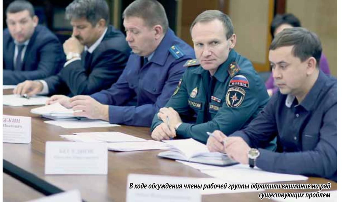
В ходе обсуждения члены рабочей группы обратили внимание на ряд существующих проблем

НЕ ТОЛЬКО ПРОАНАЛИЗИРОВАТЬ, НО И НАЙТИ ПУТИ РЕШЕНИЯ ПРОБЛЕМЫ БЕЗОПАСНОГО ГАЗОСНАБЖЕНИЯ ЮЖНОУРАЛЬЦЕВ — ОСНОВНАЯ ЗАДАЧА РАБОЧЕЙ ГРУППЫ, КОТОРАЯ СОЗДАНА ПРИ ЗАКОНОДАТЕЛЬНОМ СОБРАНИИ ЧЕЛЯБИНСКОЙ ОБЛАСТИ ПО РЕШЕНИЮ РУКОВОДИТЕЛЯ ДЕПУТАТСКОГО КОРПУСА ВЛАДИМИРА МЯКУША (ФРАКЦИЯ «ЕДИНАЯ РОССИЯ»). ВОЗГЛАВИЛ ЕЕ ПЕРВЫЙ ЗАМЕСТИТЕЛЬ ПРЕДСЕДАТЕЛЯ РЕГИОНАЛЬНОГО ПАРЛАМЕНТА ЮРИЙ КАРЛИКАНОВ (ФРАКЦИЯ «ЕДИНАЯ РОССИЯ»).