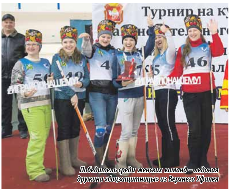
Победитель среди женских команд – ледовая дружина «Соцзащитницы» из Верхнего Уфалея

Соревнования открыли хоккейные баталии между командами депутатов Законодательного Собрания, сборной Федерации профсоюзов, дружины Челябинской городской думы, а также управления ЮУЖД. Победу праздновали депутаты Законодательного Собрания.