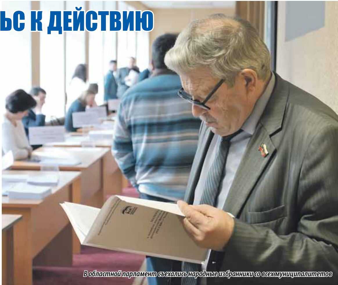
В областной парламент съехались народные избранники со всех муниципалитетов