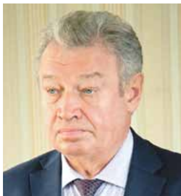
Анатолий БРАГИН, заместитель председателя Законодательного Собрания, председатель комитета по законодательству, государственному строительству и местному самоуправлению (фракция «Единая Россия»):

Эти и другие предложения в случае принятия, на мой взгляд, позволят уравновесить государственную систему, перераспределив полномочия исполнительной и представительной ветвей власти».