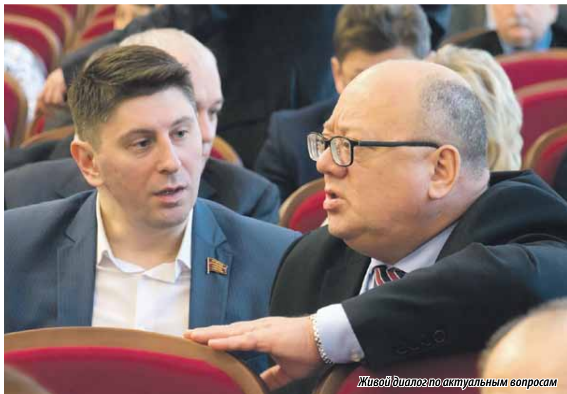
Живой диалог по актуальным вопросам