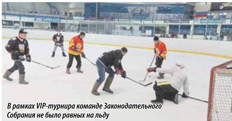
В рамках VIP-турнира команде Законодательного Собрания не было равных на льду

В хоккее наша команда играет уже четвертый год, в Верхнем Уфалее также проводятся соревнования по хоккею в валенках, и в родном городе три года подряд мы занимали только первые места. В прошлом году на Кубке Законодательного Собрания, приехав впервые, заняли третье место. А в этом стали победителями среди женских команд. Хотя надо отдать должное соперницам – они были очень сильны и заслужили наше уважение.