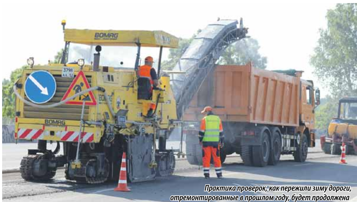
Практика проверок, как пережили зиму дороги, отремонтированные в прошлом году, будет продолжена