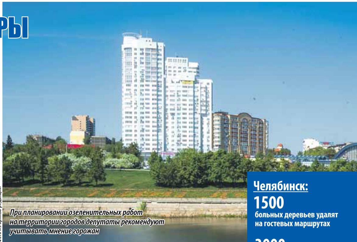
При планировании озеленительных работ на территории городов депутаты рекомендуют учитывать мнение горожан

рябины, ели, сосны и лиственницы. Из кустарников решено приобрести кизильник, барбарис, сирень и другие.