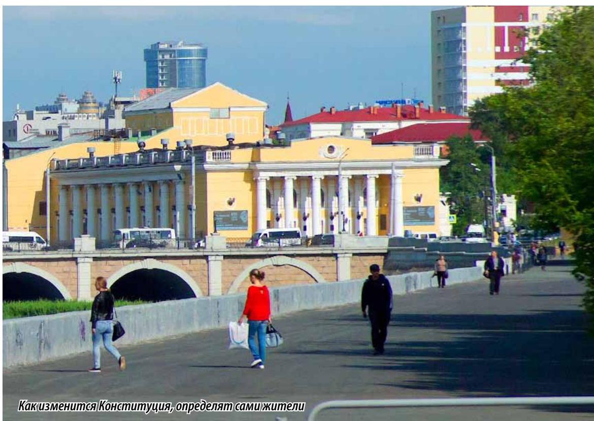
Как изменится Конституция, определят сами жители