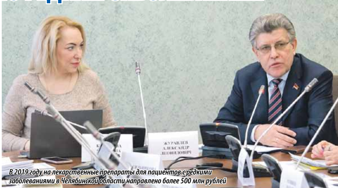
В 2019 году на лекарственные препараты для пациентов с редкими заболеваниями в Челябинской области направлено более 500 млн рублей

СЕГОДНЯ В НАШЕЙ СТРАНЕ АКТИВНО ВЕДЕТСЯ РАЗРАБОТКА НАЦИОНАЛЬНОЙ СТРАТЕГИИ ПО ПРОФИЛАКТИКЕ И ЛЕЧЕНИЮ РЕДКИХ, ИЛИ ОРФАННЫХ, ЗАБОЛЕВАНИЙ. ЕЕ ВНЕДРЕНИЕ ПОЗВОЛИТ РЕАЛИЗОВАТЬ СИСТЕМНЫЙ ПОДХОД К РЕШЕНИЮ ВОПРОСОВ РЕДКИХ ЗАБОЛЕВАНИЙ, ПРИ ЭТОМ ОСНОВНЫМ ФИНАНСОВЫМ ИСТОЧНИКОМ ДОЛЖЕН СТАТЬ ГОСУДАРСТВЕННЫЙ БЮДЖЕТ. ВСТРЕЧА ЮЖНОУРАЛЬСКИХ ПАРЛАМЕНТАРИЕВ С НЕПОСРЕДСТВЕННЫМИ РАЗРАБОТЧИКАМИ СТРАТЕГИИ ПРОШЛА НА ПЛОЩАДКЕ ЗАКОНОДАТЕЛЬНОГО СОБРАНИЯ.