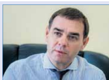
Александр ЛАЗАРЕВ, первый заместитель председателя Законодательного Собрания, председатель комитета по бюджету и налогам (фракция «Единая Россия»):

Отметим, остальные 20 млн рублей федерального трансферта пойдут на оснащение объектов спортивной инфраструктуры. Предусмотрены