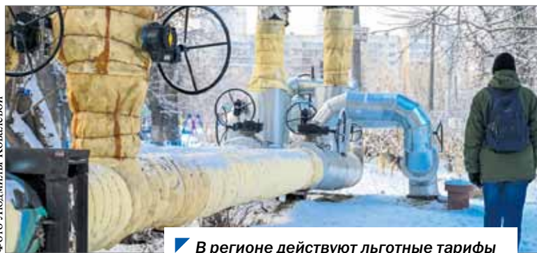
В регионе действуют льготные тарифы на тепловую энергию для населения.

На Южном Урале рост тарифов на услуги ЖКХ не превысит допустимых значений. Комитет по промышленной политике, энергетике, транспорту и тарифному регулированию обсудил данную тему.