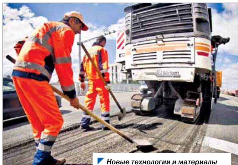
Новые технологии и материалы напрямую влияют на качество дорог.

составляет Дорожной фонд Челябинской области в 2021 году.