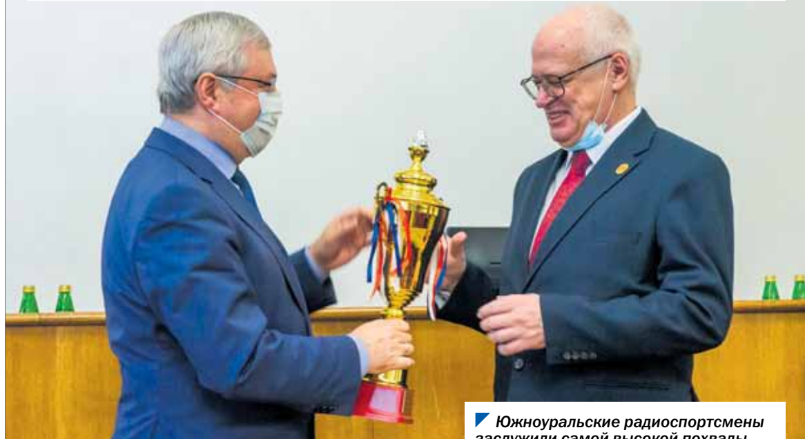
Южноуральские радиоспортсмены заслужили самой высокой похвалы.

Собрания, так и парламентарии прошлых созывов.