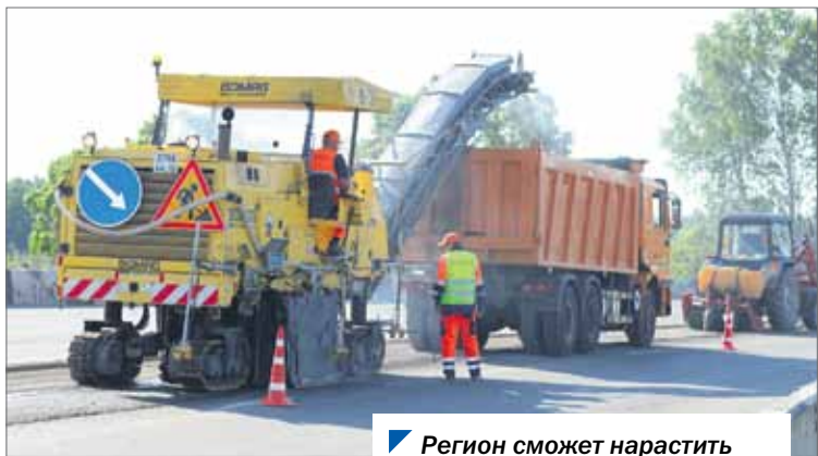
Регион сможет нарастить темпы реализации нацпроекта.

На февральском заседании депутаты Законодательного Собрания одобрили поправки к областному бюджету на 2021 год и на плановый период 2022 и 2023 годов.