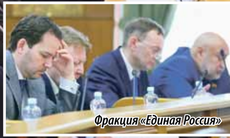
Фракция «Единая Россия»