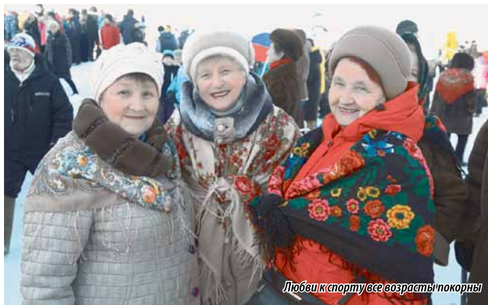
Любовь к спорту все возрасты покорны