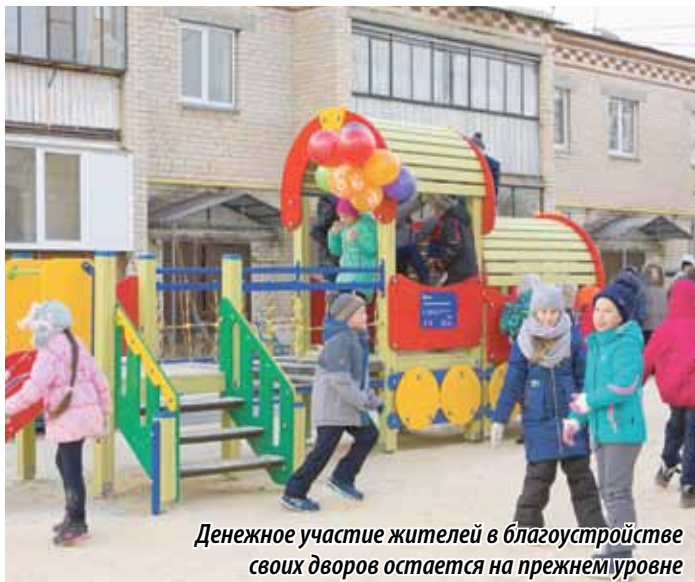
Денежное участие жителей в благоустройстве своих дворов остается на прежнем уровне

Итогом стало решение внести изменения в государственную программу Челябинской области «Благоустройство населенных пунктов Челябинской