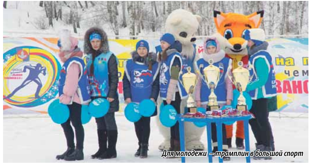
Для молодежи – трамплин в большой спорт