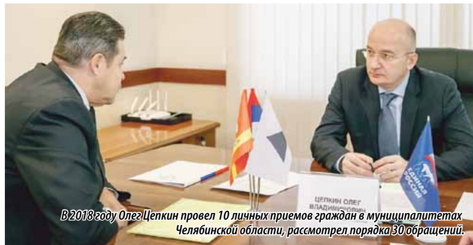
В 2018 году Олег Цепкин провел 10 личных приемов граждан в муниципалитетах Челябинской области, рассмотрел порядка 30 обращений.

Совместно с Палатой молодых законодателей при Совете Федерации Олег Цепкин организовал круглый стол «Банкротство физических лиц. Пути