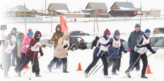
Для старшего поколения «Лыжня Тихонова» – здоровье и активный досуг

В МИНУВШУЮ СУББОТУ В УЙСКОМ РАЙОНЕ СОСТОЯЛИСЬ 37-Е ОБЛАСТНЫЕ СОРЕВНОВАНИЯ ПО ЛЫЖНЫМ ГОНКАМ «ЛЫЖНЯ ТИХОНОВА». СТАРТ ПЕРВОМУ ЗАБЕГУ ЛИЧНО ДАЛ ЧЕТЫРЕХКРАТНЫЙ ОЛИМПИЙСКИЙ ЧЕМПИОН, ЛЕГЕНДА МИРОВОГО БИАТЛОНА АЛЕКСАНДР ИВАНОВИЧ ТИХОНОВ.