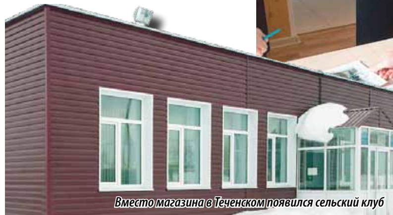
Вместо магазина в Теченском появился сельский клуб

ФРАЗУ «ТЕАТР НАЧИНАЕТСЯ С ВЕШАЛКИ», ОДНОГО ИЗ ОСНОВАТЕЛЕЙ МХАТА КОНСТАНТИНА СТАНИСЛАВСКОГО, В ПОСЕЛКЕ ТЕЧЕНСКОМ СОСНОВСКОГО РАЙОНА ЧЕЛЯБИНСКОЙ ОБЛАСТИ, БЕЗУСЛОВНО, СЛЫШАЛИ. НО УЖЕ НЕСКОЛЬКО ЛЕТ, А ТО И ДЕСЯТИЛЕТИЙ, ВХОДЯ В МЕСТНЫЙ СЕЛЬСКИЙ КЛУБ, НЕ ИСПОЛЬЗОВАЛИ ЗА НЕНАДОБНОСТЬЮ. ОСОБЕННО ЗИМОЙ, КОГДА ВЕРХНЮЮ ОДЕЖДУ В КЛУБЕ СНИМАТЬ БЫЛО РИСКОВАННО — КАК ЖИТЕЛЯМ В ЗРИТЕЛЬНОМ ЗАЛЕ, ТАК И АРТИСТАМ НА СЦЕНЕ. КАЗАЛОСЬ, УЧРЕЖДЕНИЕ ДОЖИВАЕТ СВОИ ДНИ. ОДНАКО В 2018 ГОДУ ПАРТИЙНЫЙ ПРОЕКТ «КУЛЬТУРА МАЛОЙ РОДИНЫ» ВОДХНУЛ В НЕГО ТЕПЛОЕ ДЫХАНИЕ НОВОЙ ЖИЗНИ.