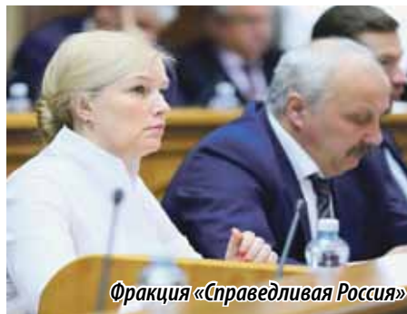
Фракция «Справедливая Россия»

Впрочем, таким оказался и сам февраль, центральным событием которого для всей страны стало Послание президента России Владимира Путина Федеральному Собранию. Так, одной из магистральных тем ежегодного обращения главы государства стало социально-экономическое развитие регионов. В свою очередь к ключевым вопросам повестки заседания южноуральского парламента стоит отнести изменения в областном бюджете в целях лекарственного обеспечения отдельных категорий жителей, а также поправки в закон, содействующие эффективному функционированию ТЭСР в Челябинской области.