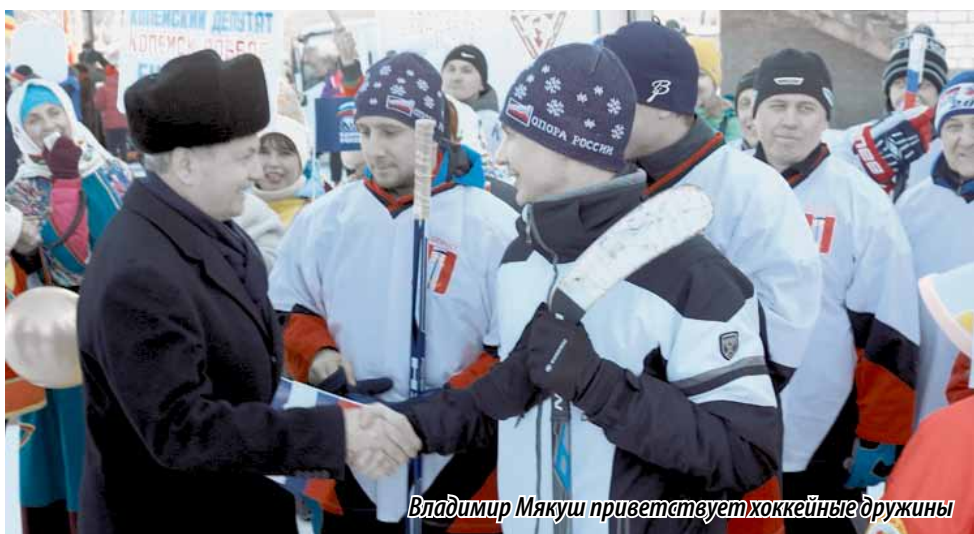
Владимир Мякуш приветствует хоккейные дружины

Владимир МЯКУШ , председатель Законодательного Собрания Челябинской области (фракция «Единая Россия»):