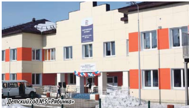
Детский сад №5 «Рябинка»

В изит в районный центр состоялся в день заседания местного Межмуниципального координационного совета «Единой России», главной темой которого стали вопросы исполнения наказов южноуральцев, полученных в ходе выборов в Государственную Думу. В частности, в Верхнеуральске одни указы уже получили свое конкретное воплощение, другие пока еще ждут своего часа, и у людей есть уверенность, что они будут выполнены, ибо слова не расходятся с делом, вернее с «Реальными делами».