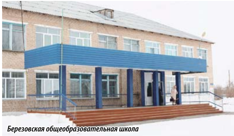
Березовская общеобразовательная школа

В ЧЕЛЯБИНСКОЙ ОБЛАСТИ ПРИ АКТИВНОМ УЧАСТИИ ДЕПУТАТОВ ФРАКЦИИ «ЕДИНАЯ РОССИЯ» ПРОДОЛЖАЕТСЯ РЕАЛИЗАЦИЯ ПРОЕКТА «ДЕТСКИЙ СПОРТ». НА ЭТОТ РАЗ ТОРЖЕСТВЕННОЕ ОТКРЫТИЕ ОБНОВЛЕННОГО СПОРТИВНОГО ЗАЛА СОСТОЯЛОСЬ В ПОСЕЛКЕ БЕРЕЗОВСКОМ УВЕЛЬСКОГО МУНИЦИПАЛЬНОГО РАЙОНА. В МЕСТНОЙ ШКОЛЕ ПО ЭТОМУ ПОВОДУ БЫЛ ОРГАНИЗОВАН ЯРКИЙ СПОРТИВНЫЙ ПРАЗДНИК, НА КОТОРЫЙ ПРИЕХАЛИ ВЫСОКИЕ ГОСТИ – ДЕПУТАТ ЗАКОНОДАТЕЛЬНОГО СОБРАНИЯ ЧЕЛЯБИНСКОЙ ОБЛАСТИ, ПРЕДСЕДАТЕЛЬ КОМИТЕТА ПО ИНФОРМАЦИОННОЙ ПОЛИТИКЕ МАРИНА ПОДДУБНАЯ (ФРАКЦИЯ «ЕДИНАЯ РОССИЯ»), РЕГИОНАЛЬНЫЙ КООРДИНАТОР ПРОЕКТА «ДЕТСКИЙ СПОРТ» ДЕНИС ЛАПОТЫШКИН, ГЛАВА УВЕЛЬСКОГО МУНИЦИПАЛЬНОГО РАЙОНА СЕРГЕЙ РОСЛОВ.