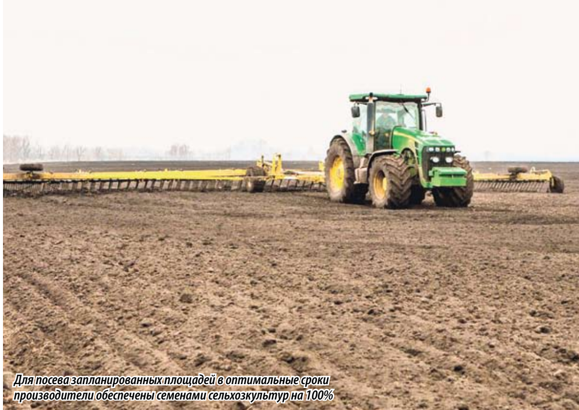
Для посева запланированных площадей в оптимальные сроки производители обеспечены семенами сельхозкультур на 100%

Для посева запланированных площадей в оптимальные сроки производители обеспечены семенами сельхозкультур на 100%. На сегодняшний день приобретено более 2,14 тысячи тонн минеральных удобрений. Между тем потребность составляет 7,2 тысячи тонн. Добор недостающих минеральных удобрений начнется после того, как министерство сельского хозяйства Челябинской области выплатит государственные субсидии на погектарную поддержку. Первые сельхозтоваропроизводители уже получают средства.