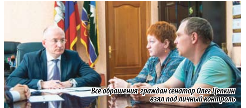
Все обращения граждан сенатор Олег Цепкин взял под личный контроль

ПРЕДСТАВИТЕЛЬ ОТ ЗАКОНОДАТЕЛЬНОГО СОБРАНИЯ ЧЕЛЯБИНСКОЙ ОБЛАСТИ В СОВЕТЕ ФЕДЕРАЦИИ, ЧЛЕН КОМИТЕТА СФ ПО КОНСТИТУЦИОННОМУ ЗАКОНОДАТЕЛЬСТВУ, ПРОВЕЛ ЛИЧНЫЙ ПРИЕМ ГРАЖДАН В ТРЕХГОРНОМ.