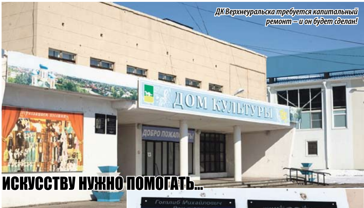
ДК Верхнеуральска требуется капитальный ремонт — и он будет сделан!