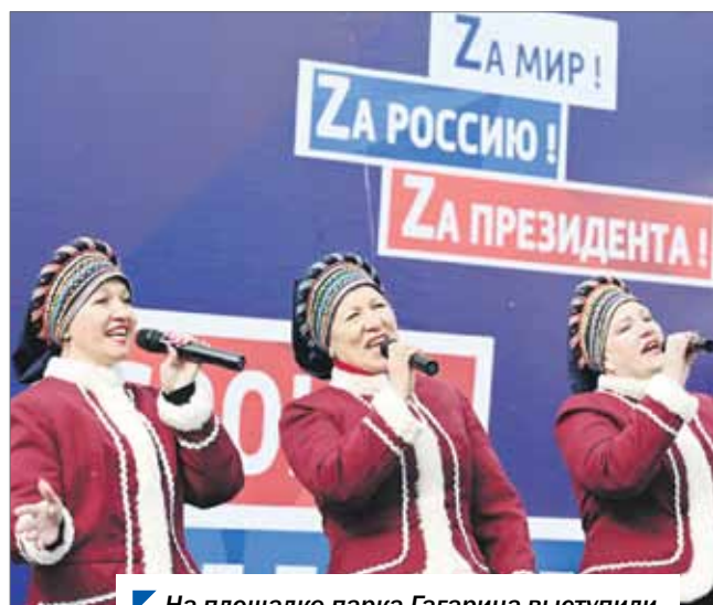
На площадке парка Гагарина выступили творческие коллективы со всего региона.