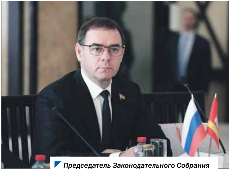
Председатель Законодательного Собрания обратился к промышленникам Южного Урала.

Председатель Законодательного Собрания Александр Лазарев принял участие в объединенном заседании правления Челябинской региональной организации и Челябинской областной ассоциации работодателей Союза промышленников и предпринимателей.