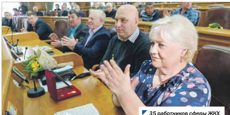
35 работников сферы ЖКХ стали лауреатами премии.

Более 400 работников ЖКХ стали лауреатами премии Законодательного Собрания с момента ее учреждения.