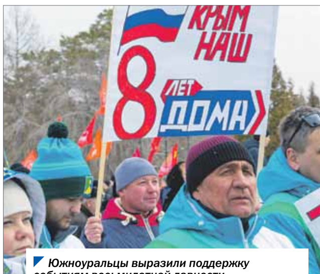
Южноуральцы выразили поддержку событиям восьмилетней давности и сегодняшним решениям руководства страны.