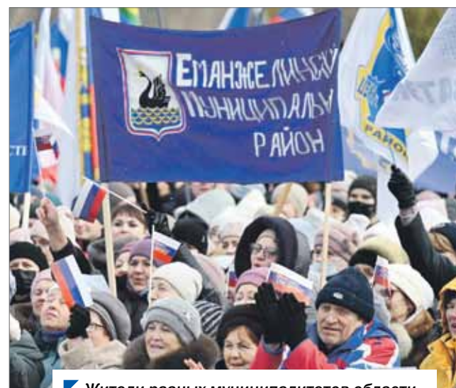
Жители разных муниципалитетов области приехали встретить Крымскую весну.