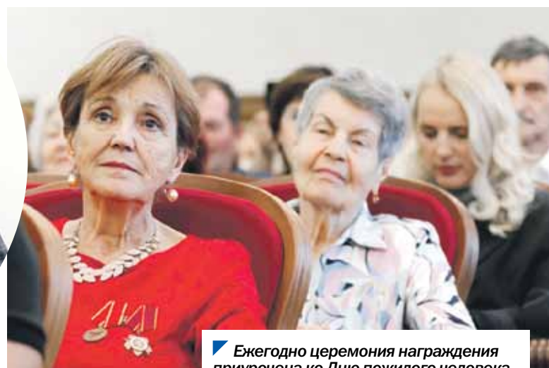
Ежегодно церемония награждения приурочена ко Дню пожилого человека.