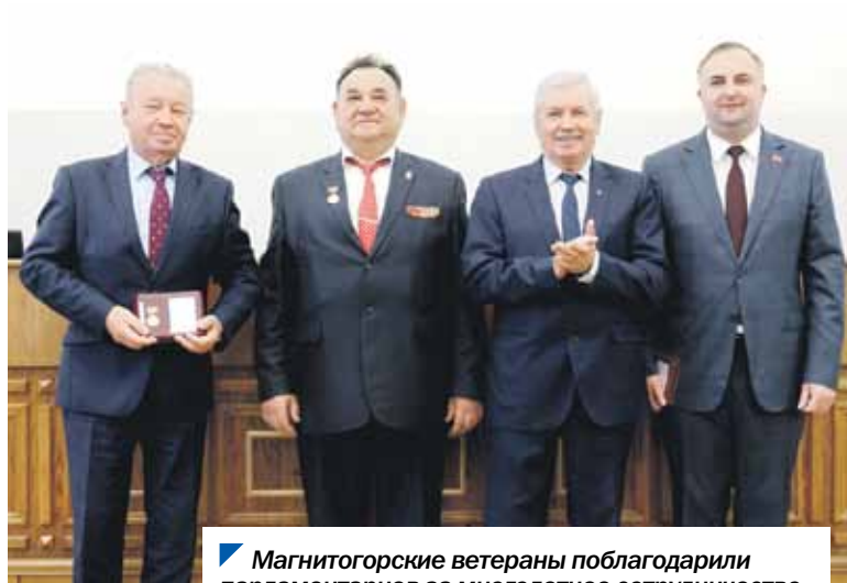
Магнитогорские ветераны поблагодарили парламентариев за многолетнее сотрудничество.