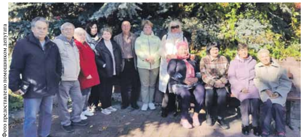
Фото предоставлено помощником депутата