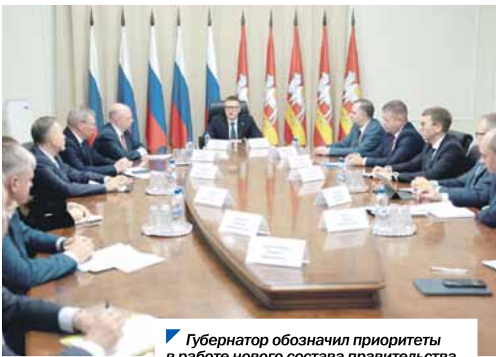
Губернатор обозначил приоритеты в работе нового состава правительства.