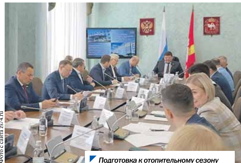
Подготовка к отопительному сезону находится на особом контроле депутатов.

коммунальных сетей отремонтировано в Челябинской области в 2024 году.