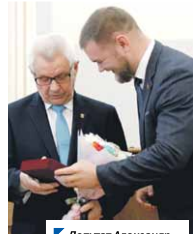
Депутат Александр Долгушин вручает заслуженную награду.