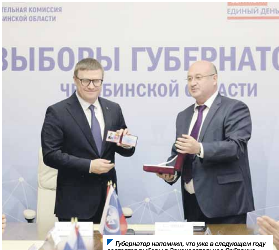
Губернатор напомнил, что уже в следующем году состоятся выборы в Законодательное Собрание.