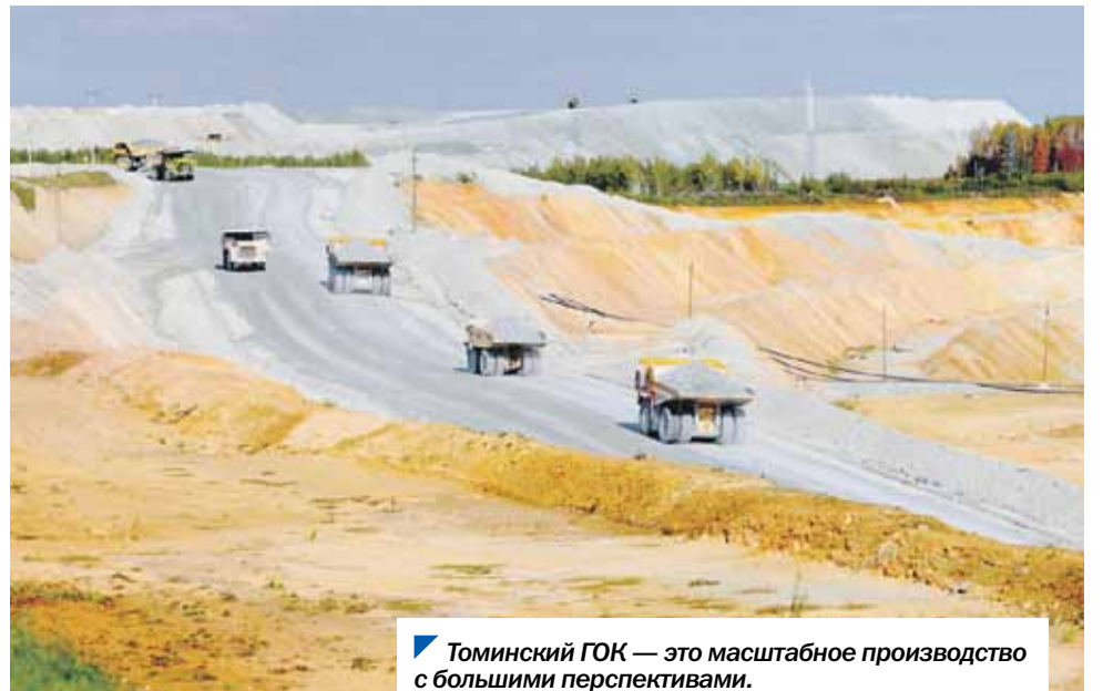
Томинский ГОК — это масштабное производство с большими перспективами.

По словам и.о. министра промышленности региона Михаила Кнауба, в этом году субсидии на возмещение части затрат на приобретение оборудования получили 10 предприятий, льготное заемное финансирование направлено на восемь проектов, 21 предприятию возмещена часть затрат на уплату платежей по договорам лизинга, заключенным с российскими