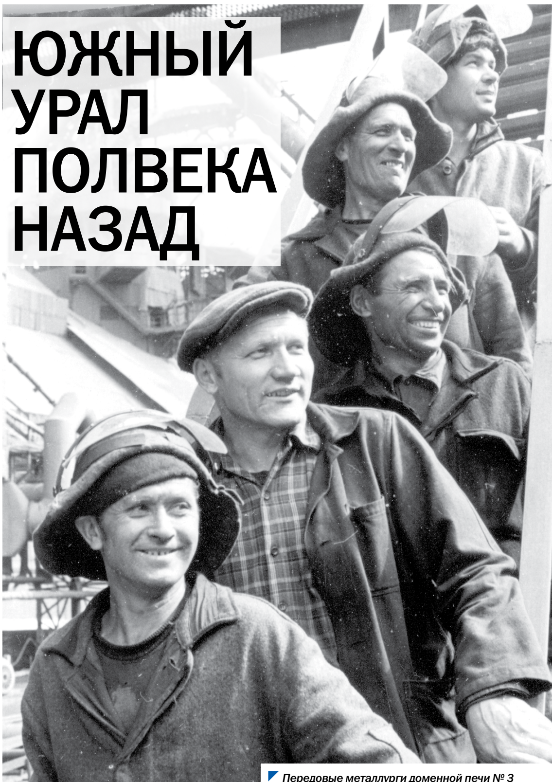
Передовые металлурги доменной печи № 3 Челябинского металлургического завода, 1974 год.