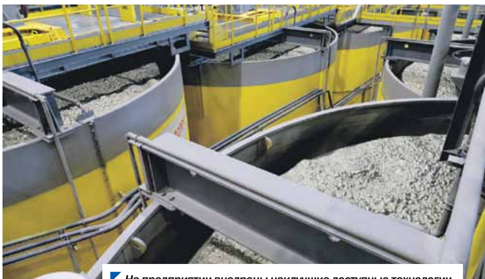
На предприятии внедрены наилучшие доступные технологии.

/// За 2023 год индекс промышленного производства в нашем регионе составил 110%. Это результат работы по поддержке промышленной отрасли в Челябинской области. В регионе реализуются масштабные инвестиционные проекты, связанные с созданием новых производств. Динамично развиваются и традиционные направления. Это основа для того, чтобы наш регион был успешен и в будущем. Такие тенденции нужно подкреплять самыми различными мерами господдержки. ///