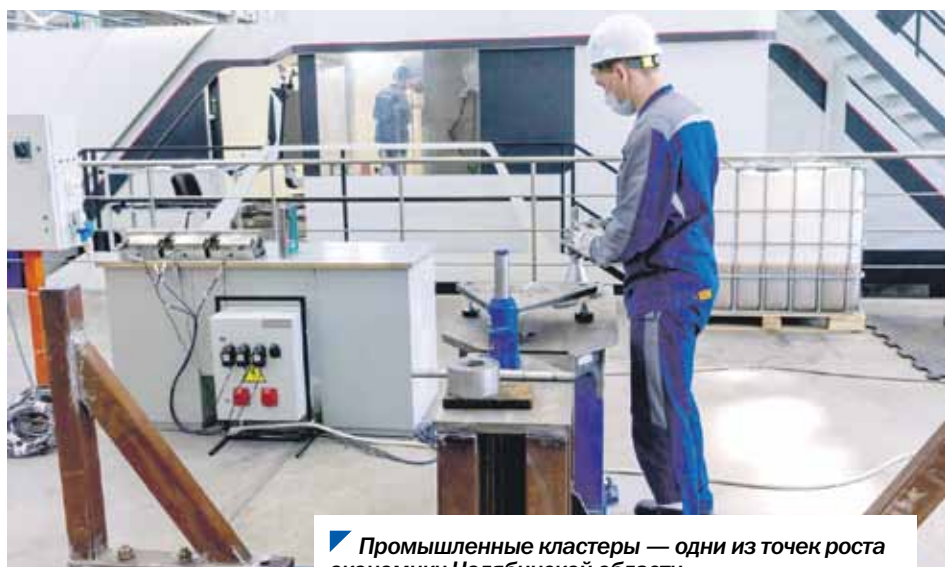
Промышленные кластеры — одни из точек роста экономики Челябинской области.

По словам вице-спикера южноуральского парламента, в областном бюджете в этом году на гранты для промышленных кластеров предусмотрено 70 миллионов рублей. На выездном заседании комитета по промышленной политике, энергетике, транспорту и тарифному регулированию в сентябре депутаты отметили своевременность, важность и востребованность этой региональной меры поддержки.