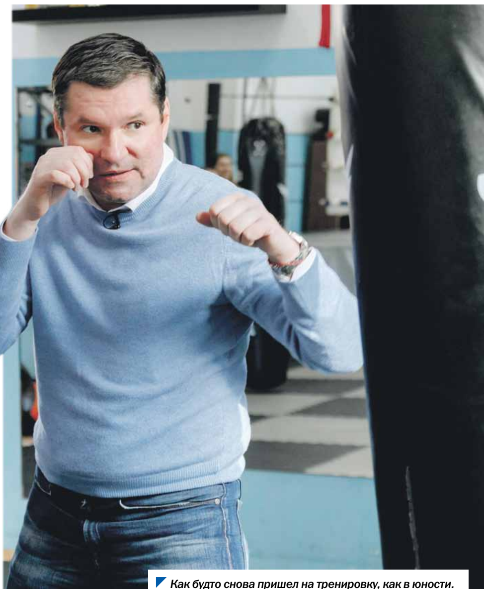
▶ Как будто снова пришел на тренировку, как в юности.