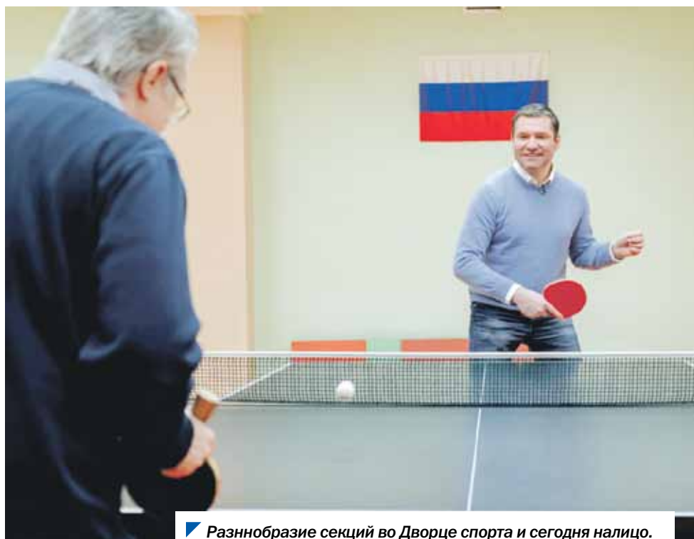
▶ Разнообразие секций во Дворце спорта и сегодня налицо.