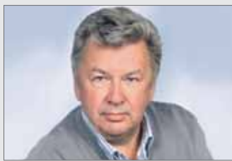
Андрей ВАЖЕНИН родился 18 марта.

Депутат по Северному избирательному округу № 1, заместитель председателя комитета Законодательного Собрания по законодательству, государственному строительству и местному самоуправлению, входит в состав комитета Законодательного Собрания по социальной политике.