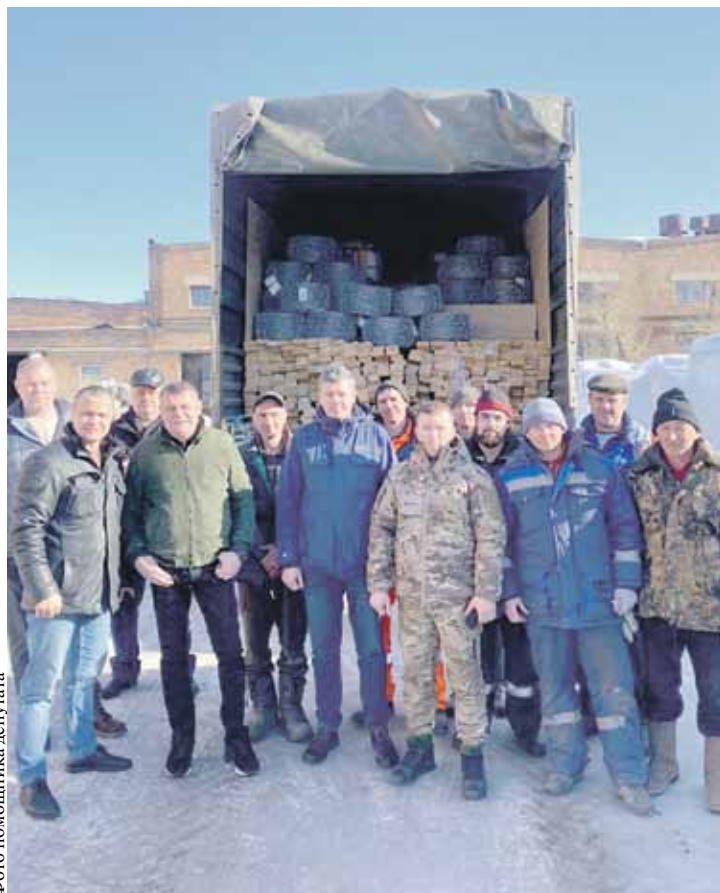
Фото помощника депутата