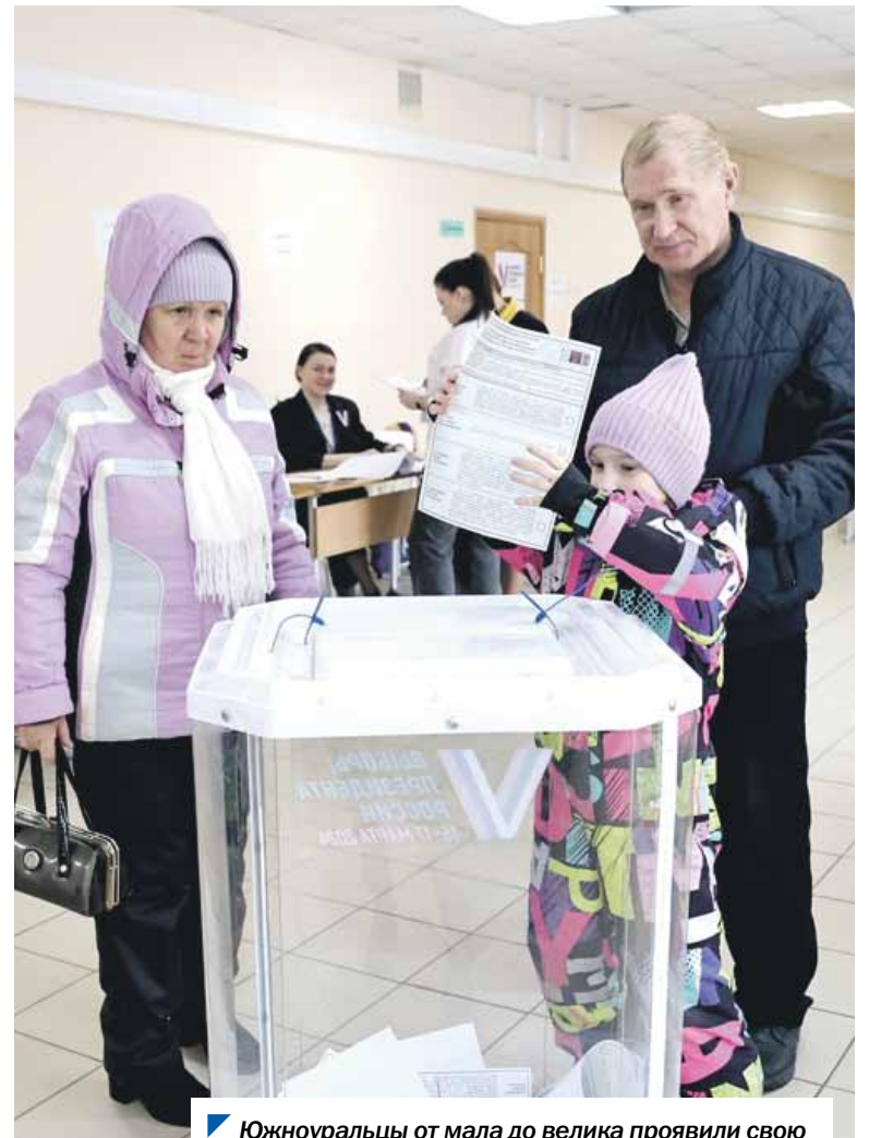
Южноуральцы от мала до велика проявили свою гражданскую позицию на выборах президента.

Явка избирателей Челябинской области на нынешних выборах президента России уже вошла в историю как одна из самых высоких не только для самого региона, но и в целом по стране. Интересно, кто из южноуральских муниципалитетов здесь оказался, как говорится, впереди планеты всей?