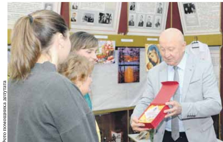
Фото помощника депутата

Кроме того, гости посетили выставку самодеятельного творчества ветеранов университета, экспонаты которой будут представлены на городской выставке «Умелые руки — 2024».