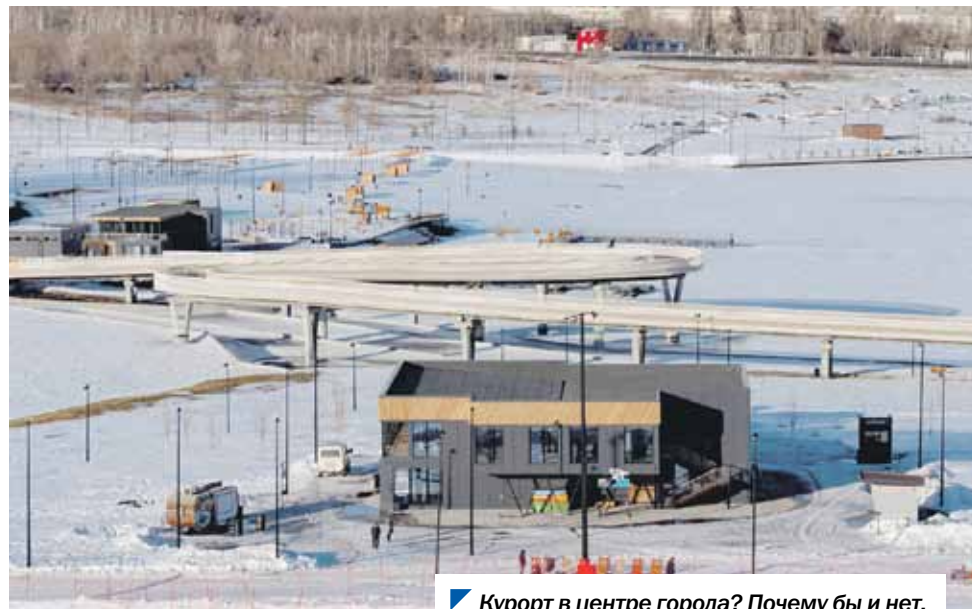
Курорт в центре города? Почему бы и нет.