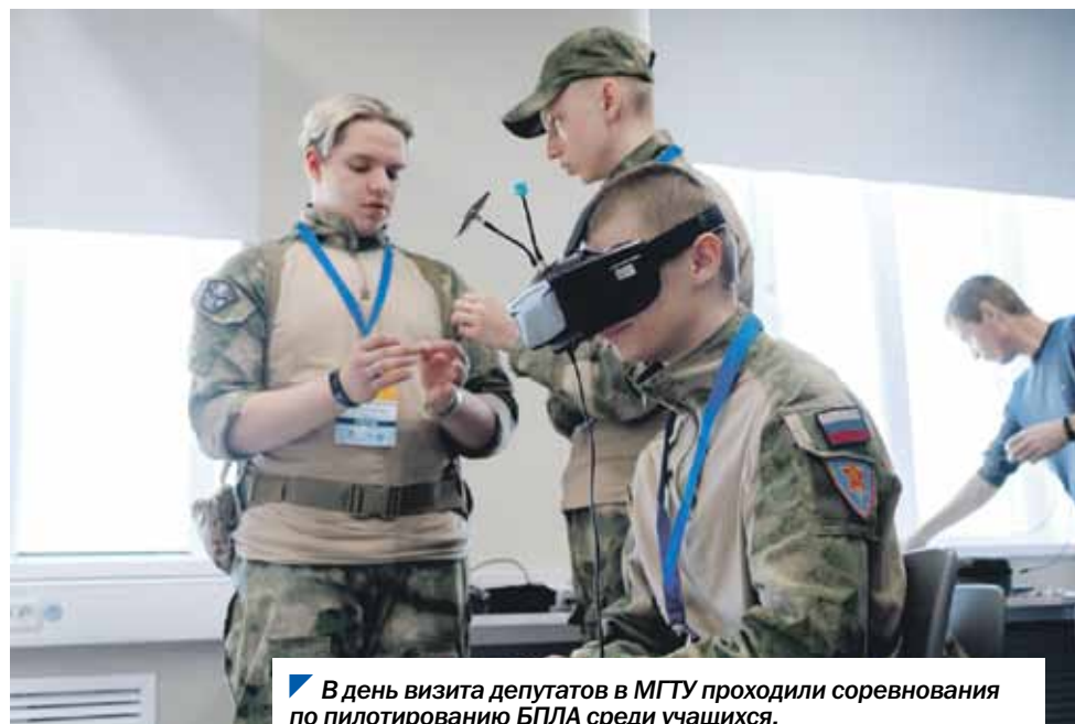
В день визита депутатов в МГТУ проходили соревнования по пилотированию БПЛА среди учащихся.