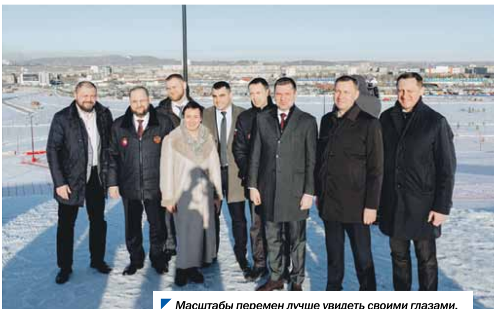
Масштабы перемен лучше увидеть своими глазами.