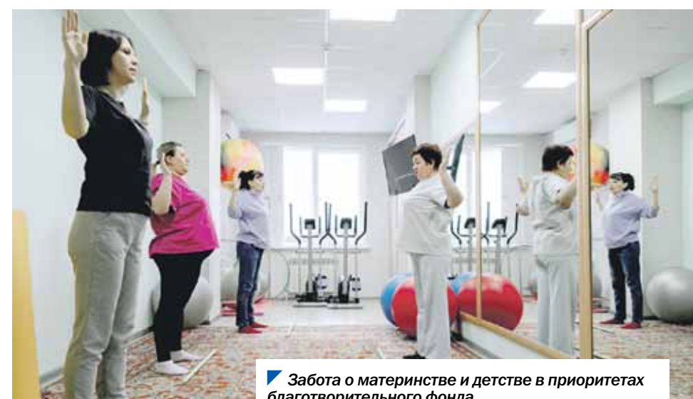
Забота о материнстве и детстве в приоритетах благотворительного фонда.