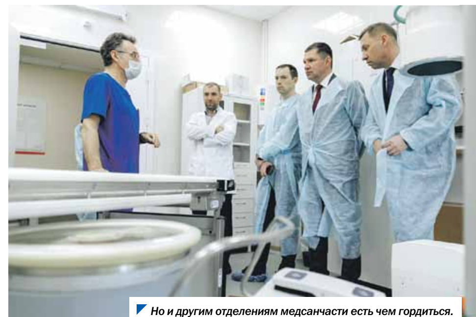
Но и другим отделениям медсанчасти есть чем гордиться.