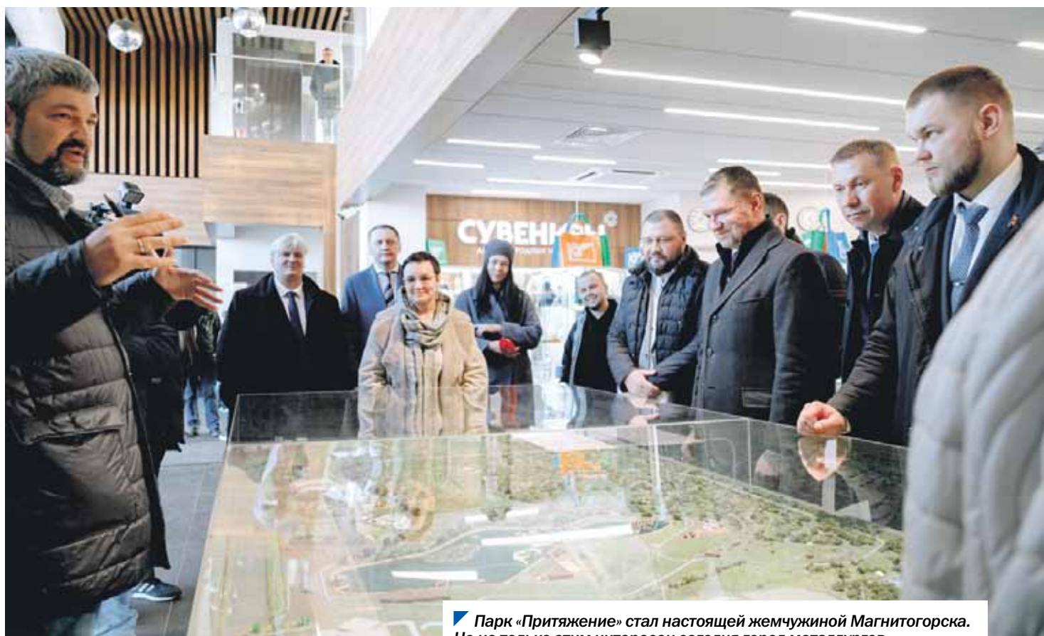
Парк «Притяжение» стал настоящей жемчужиной Магнитогорска. Но не только этим интересен сегодня город металлургов.

Депутаты комитета по социальной политике посетили Магнитогорск