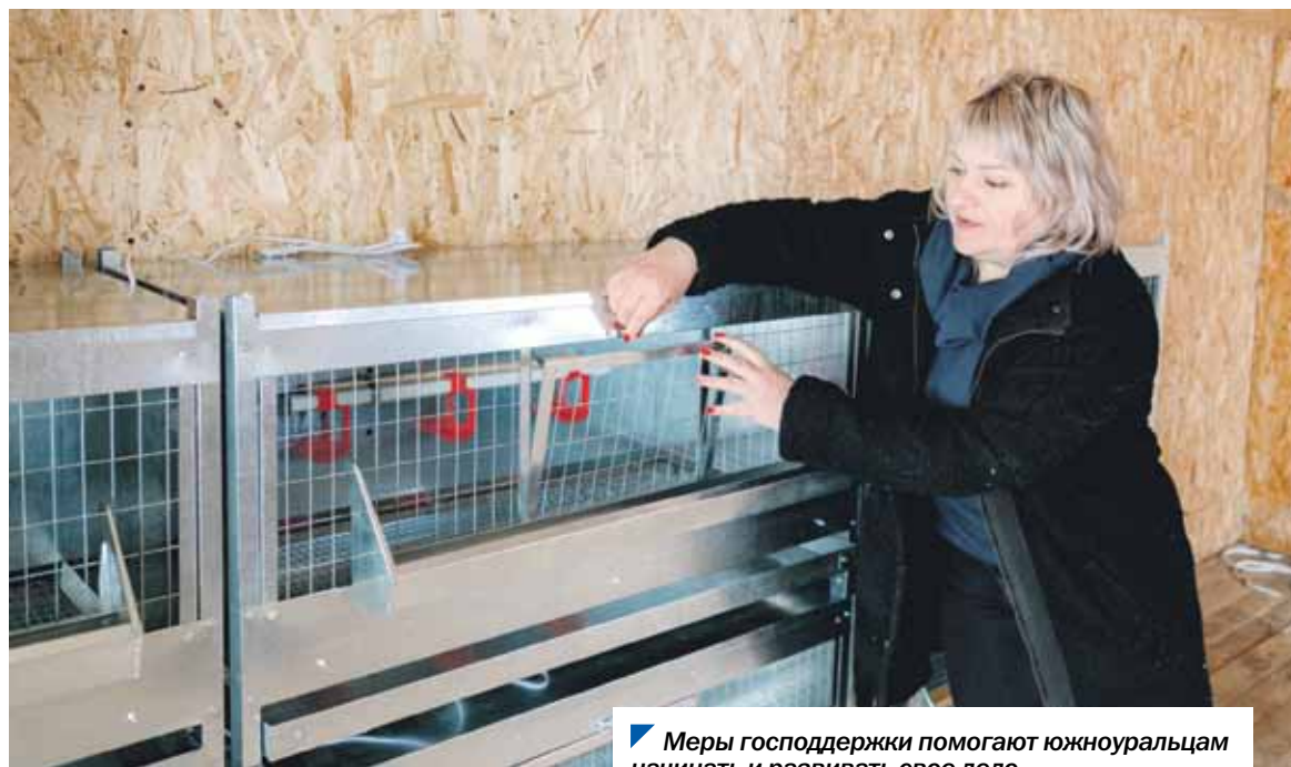
Меры господдержки помогают южноуральцам начинать и развивать свое дело.

Экономика региона продолжает перестраиваться и адаптироваться к новым условиям, показывая уверенный рост. За счет федеральных и региональных мер господдержки, импортозамещения, развития промышленных производств, реализации инвестиционных проектов активно развивается малый и средний бизнес.