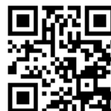
Присоединяйтесь к сообществу Законодательного Собрания во «ВКонтакте».

Проект постановления «Об утверждении членов Общественной палаты Челябинской области» будет рассмотрен на заседании Законодательного Собрания.