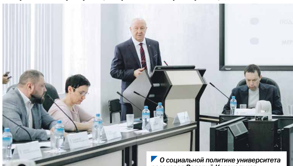
О социальной политике университета рассказал Валерий Колокольцев.

Подтверждает эти слова и новый реабилитационный центр, открывшийся в мае 2022 года. Здесь помогают пациентам неврологического, нейрохирургического и травматологического профилей. На трех этажах здания располагаются приемный покой, палаты для пациентов, залы ЛФК и эрготерапии, кабинеты физиотерапии и зал реабилитации. Центр действительно обладает уникальным медоборудованием: экзоскелеты, двигательные аппараты для продолжительной пассивной и