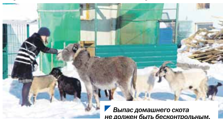
Выпас домашнего скота не должен быть бесконтрольным.