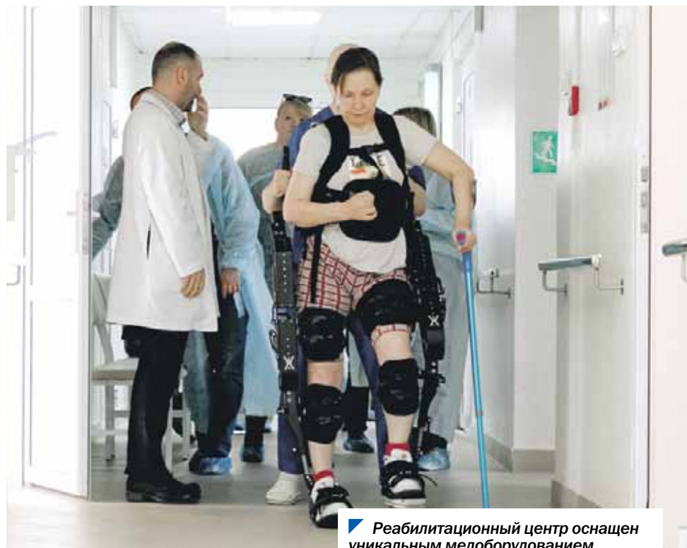
Реабилитационный центр оснащен уникальным медоборудованием.

— Социальная сфера Магнитогорска — это приоритет как для градообразующего предприятия, так и для муниципальных властей, — подвел итоги выездного заседания Сергей Буяков . — Мы увидели, как благодаря высокому уровню ответственности ММК развивается эта сфера. Уверен, работа продолжится. Со своей стороны депутаты будут и дальше уделять особое внимание южной столице Челябинской области — городу Магнитогорску.